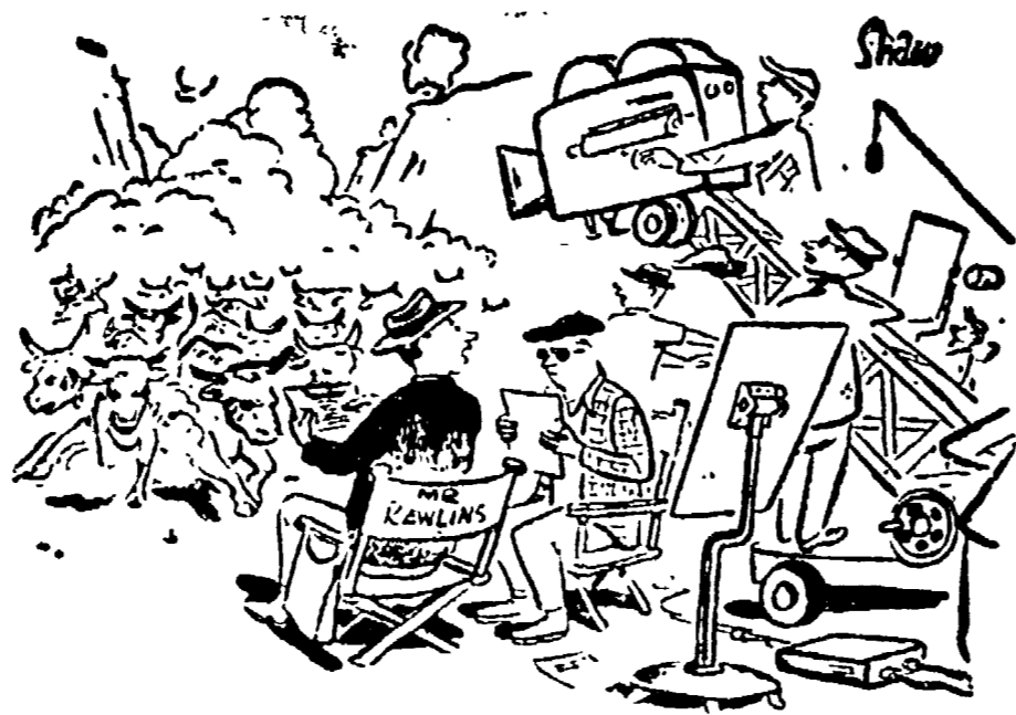
«Secondo il copione, la «varca» dovrebbe passare più a sinistra...»