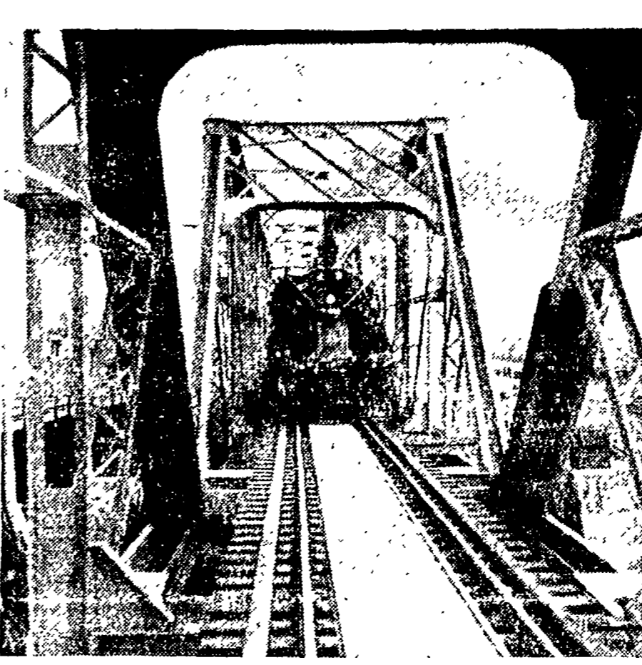
CINA — Una locomotiva imbandierata percorre il grande ponte sullo Huai, realizzazione del potere popolare