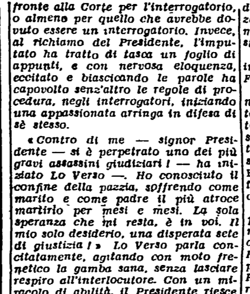
Girolamo Lo Verso