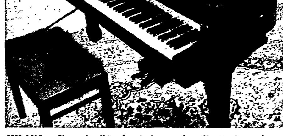
MILANO - Uno splendido pianoforte esposto nello stand cecoslovacco.

Settore per settore. Dopo il carbone, tutto il resto. La mostra nazionale è divisa in settori per settore.