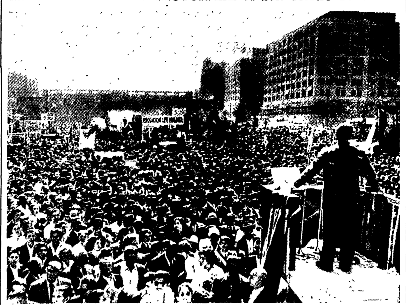
SANTIAGO DEL CILE — Manifestazione del candidato alla presidenza della Repubblica del Fronte del Popolo (socialisti e comunisti), dottor Salvador Allende. Questo candidato ha un programma anti imperialista, contro la guerra, per la riforma agraria e la nazionalizzazione delle miniere di rame. Alla manifestazione hanno assistito circa 100.000 persone. Le elezioni presidenziali avranno luogo in settembre.

UN'ALTRA MISURA DI TITO PER SANZIONARE L'ANNESSIONE DELLA «ZONA B»