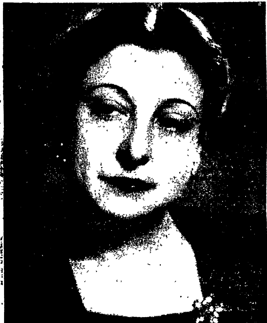
PAOLA BORBONI — Una delle maggiori attrici drammatiche italiane, profonda conoscitrice dei problemi teatrali italiani, e fautrice di un teatro di prosa stabile a Roma e della istituzione di una serie di spettacoli folkloristici e manifestazioni a carattere popolare che diano un maggiore impulso all'attività artistica romana

MAMME. SPOSE. RAGAZZE ROMANE! DATE LORO LA VOSTRA FIDUCIA, CONTRIBUITE CON IL VOSTRO VOTO AL SUCCESSO DELLA « LISTA CITTADINA » PERCHE' POSSA AVERE INIZIO UN'ATTIVITA' CHE ASSICURI AI BAMBINI E ALLE FAMIGLIE DI ROMA ALMENO L'INDISPENSABILE PER UNA VITA PIU' SERENA.