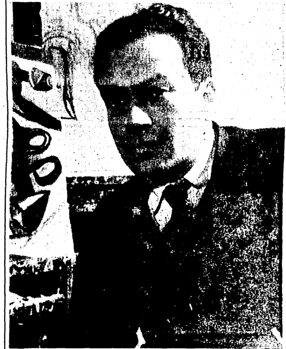
RENATO GUTTUSO , è un noto, valente artista di fama internazionale. Ama profondamente la nostra città ed il suo popolo, alla cui vita si è ispirato per comporre molte delle sue opere più apprezzate. Il volto di Roma ha in Guttuso uno dei suoi difensori. Conosce a fondo i proble-

mi degli artisti romani, che non sono solo problemi di ispirazione artistica.