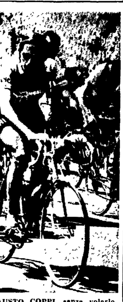
FAUSTO COPPI, senza volerlo, ha conquistato ieri la «maglia rosa» di leader