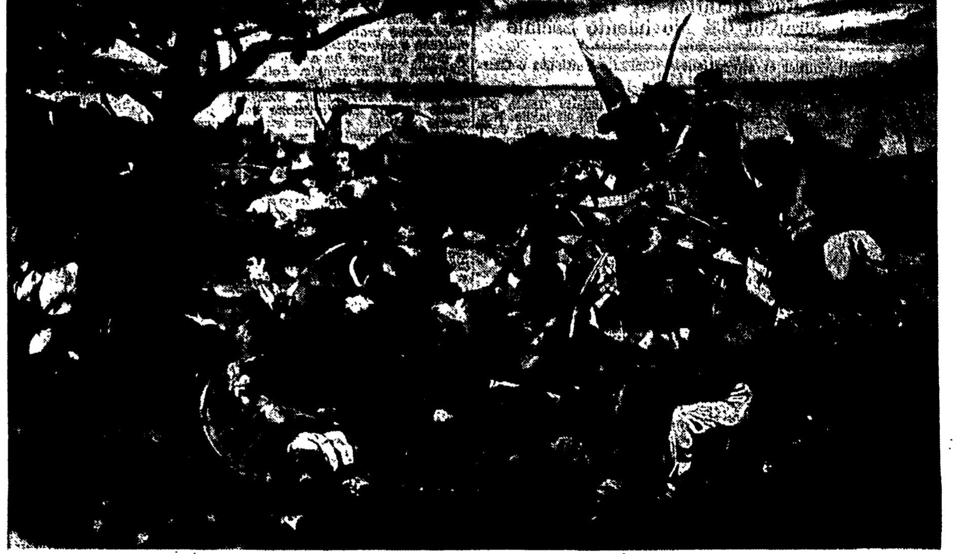
RENATO GUTTUSO: « Battaglia al Ponte dell'Ammiraglio »

Il respiro risorgimentale dei dipinti di Guttuso - Le opere di Pizzinato e di Mafai