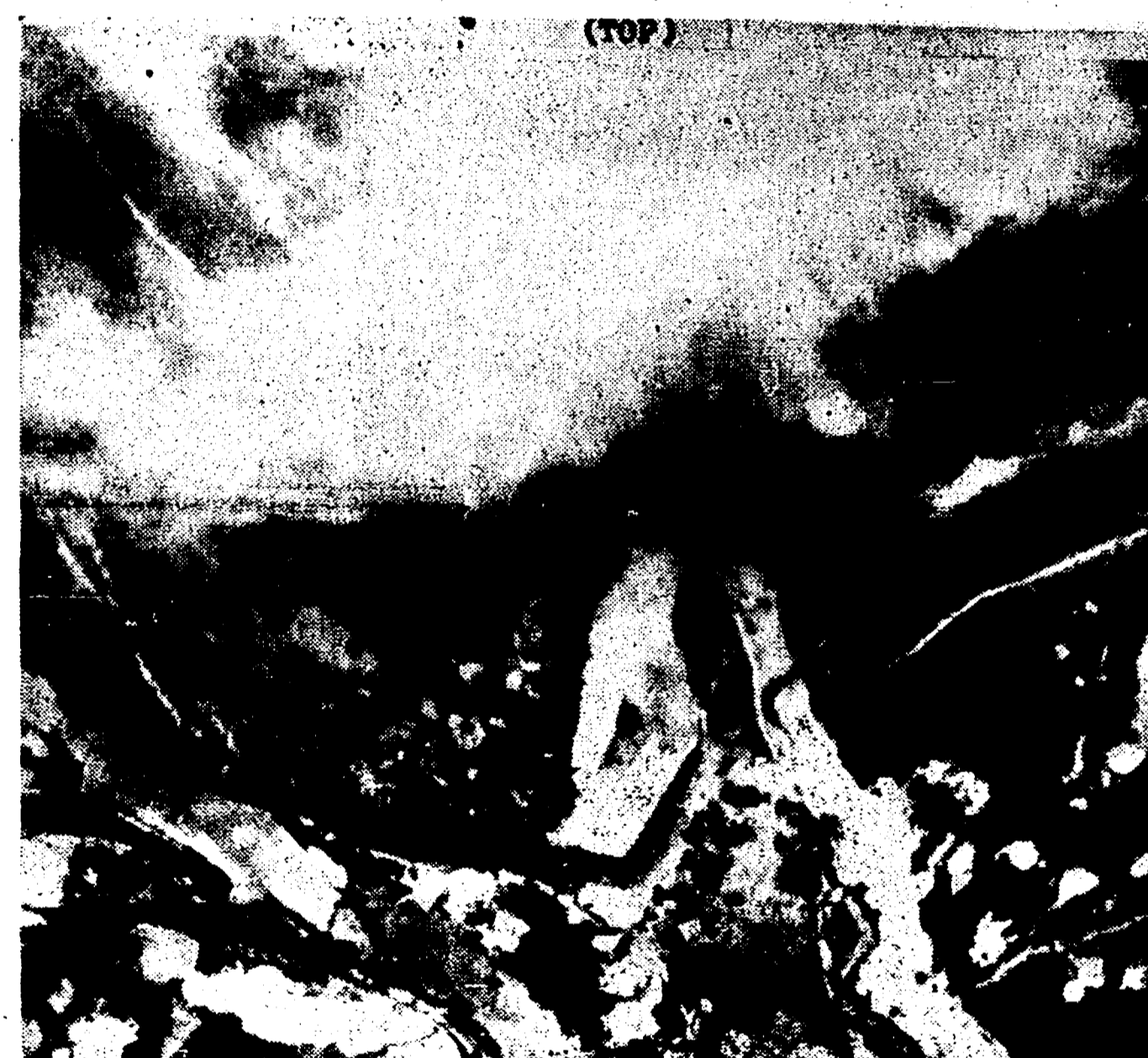
TOKIO — Le agenzie fotografiche americane hanno diffuso le prime radiotelevisive del provocatorio bombardamento, effettuato da caccia-bombardieri a reazione, sulle centrali elettriche poste sul fiume Yalu, al confine cino-coreano. Gli attacchi americani, effettuati mentre continuano le trattative armistiziali a Pan Mun Jon, hanno il chiaro scopo di provocare un allargamento del conflitto. La foto, ripresa durante il secondo bombardamento, mostra gli effetti delle deflagrazioni sugli edifici delle centrali e sulle abitazioni e uffici circostanti. Durante le criminali azioni, condotte dagli americani, donne, bambini, civili inermi sono stati massacrati