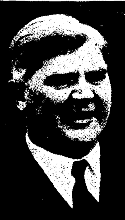
ANEURIN BEVAN, il deputato laburista inglese che ha messo sotto accusa le provocazioni americane al confine cino-coreano