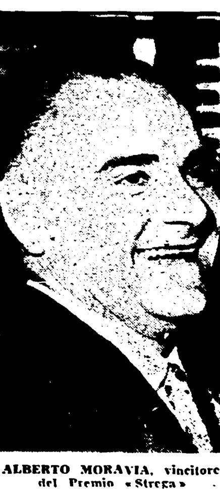
ALBERTO MORAVIA, vincitore del Premio «Strega»