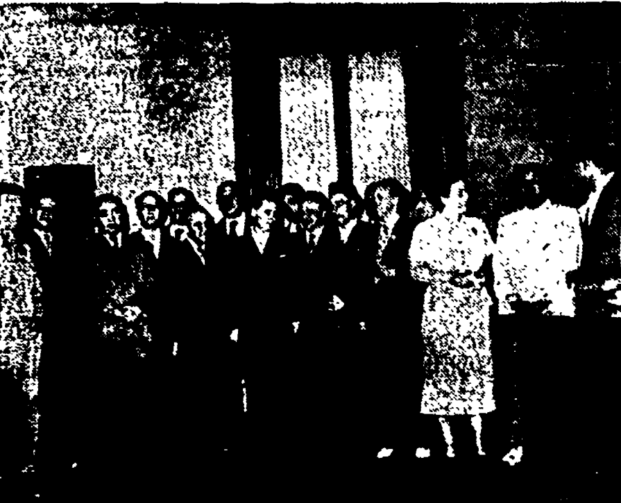
Ore 9,15: l'omaggio al Milite Ignoto; ore 9,40: l'omaggio ai martiri delle Ardeatine; ore 12: la presentazione dei Capi Divisione della Provincia agli assessori

La giunta provinciale e i rappresentanti di tutti i gruppi consiliari, come primo atto ufficiale della loro attività, hanno tributato un reso omaggio alla tomba del Milite Ignoto in Piazza Venezia e ai 335 martiri della barbarie nazifascista nel sacrario all'Ardeatina. Sono state deposte corone d'alloro recanti i colori della Provincia.