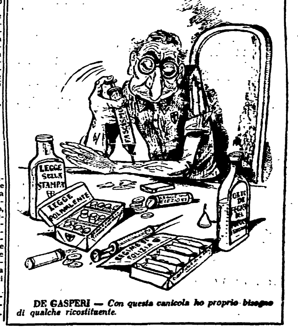
DE GASPERI - Con questa caricatura ho proprio bisogno di qualche ricostituente.