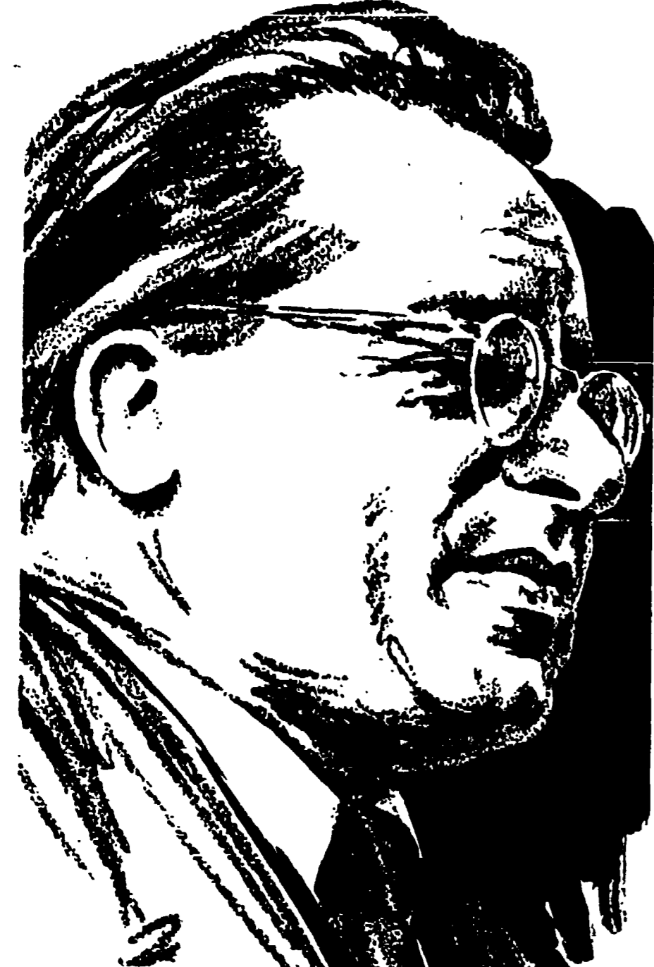
Ricorre oggi il 4° anniversario del vile attentato al compagno Palmiro Togliatti...

Dolorosa ricerca dei feriti e dei dispersi tra le macerie di Phonyngyang