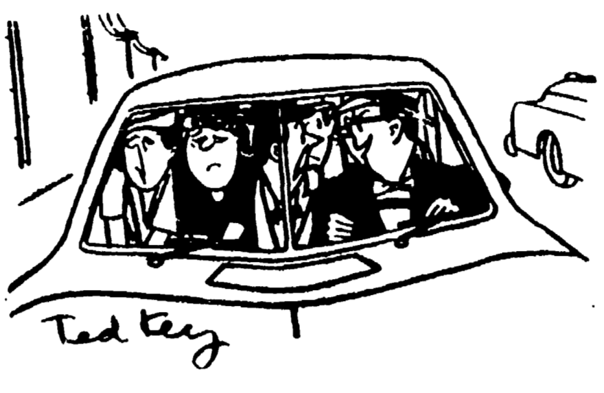
«E voi dicevate che questa macchina non poteva portarci tutti e otto, vero?...»