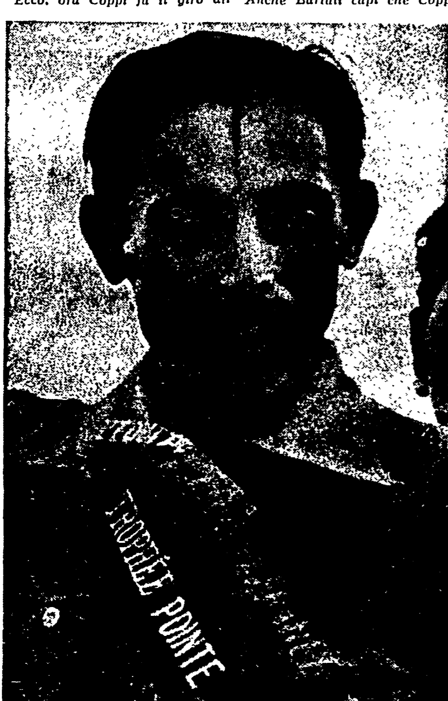
Il trionfo di FAUSTO COPPI al Pare del Prinses (teletto all'Unità)

La tappa di ieri (Dal nostro inviato speciale) PARIGI, 19. — Scelta al canto del gallo. Sessantotto uomini — i superstiti di una corsa feroce: il «Tour» — si sono accati dal letto che erano le tre e fra le 4.30 e le cinque, a Parigi, men di sonno, hanno fatto molto. L'ultimo appello: e per l'ultima volta, una bandiera che si abbassa, vola le tre e 30; gli uomini del «Tour» vanno a rompere l'ultimo traguardo: Parigi Km. 354. E' l'alba; Vichy dorme ancora. La strada è tutta piena di ruote tanto mucchio. La gendarmeria attorno a Coppi è stretta: non si sa mai... il cielo è grigio, l'aria è triste, il passo della corsa è tranquillo. Per otto ore — da Vichy a