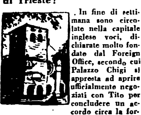
La casa di Pirandello acquistata dal governo