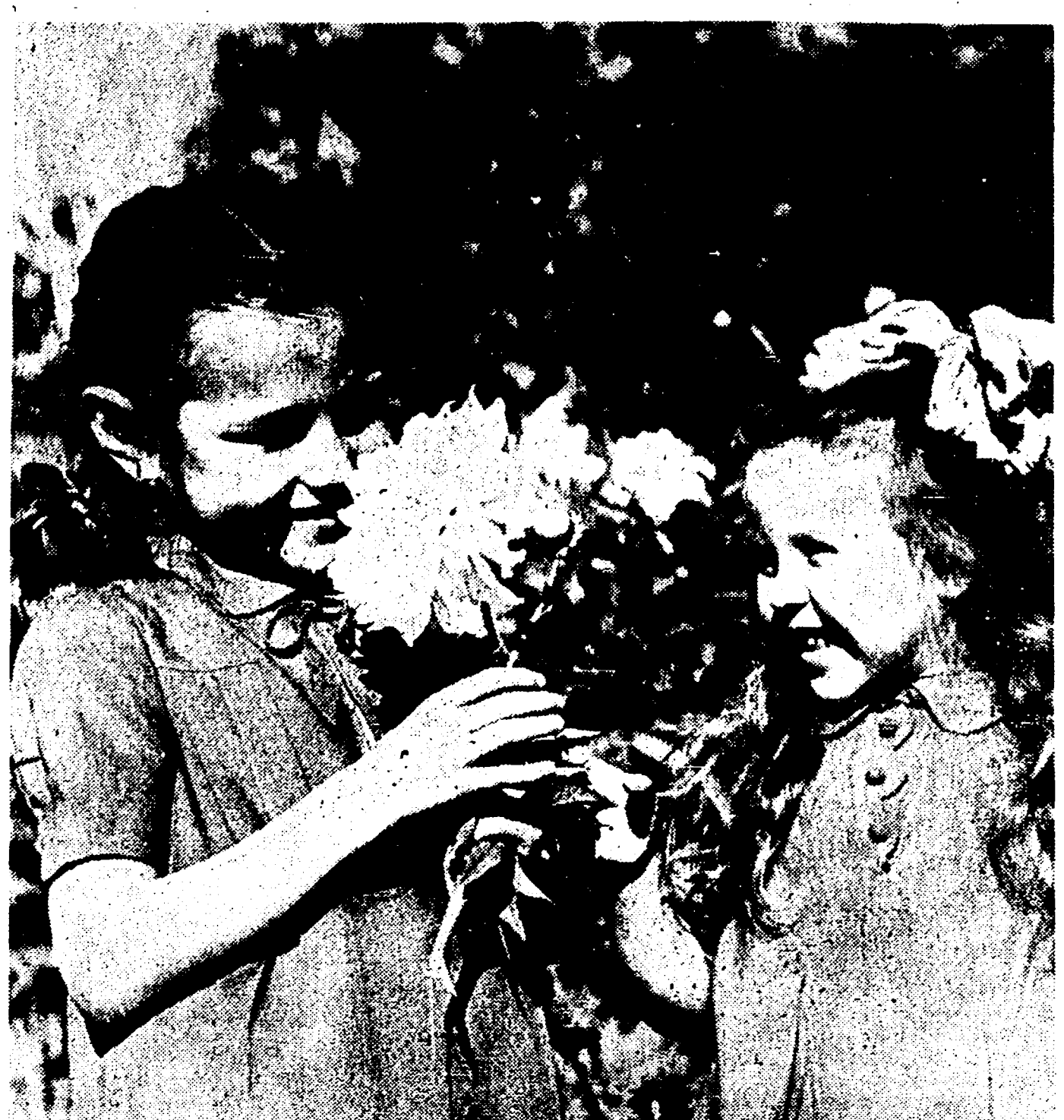
MOSCA — Due bimbe di lavoratori accolte nel giardino d'infanzia di Oufa, nella repubblica socialista sovietica della Baskiria, dove trascorreranno le vacanze