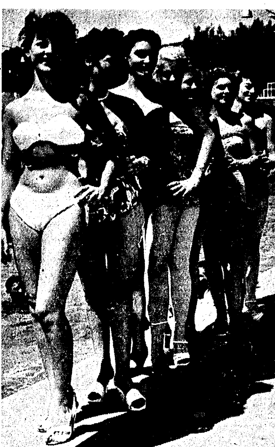
Le partecipanti all'elezione di «Miss Europa» sfilano durante una prova della manifestazione. Domani si avrà il verdetto