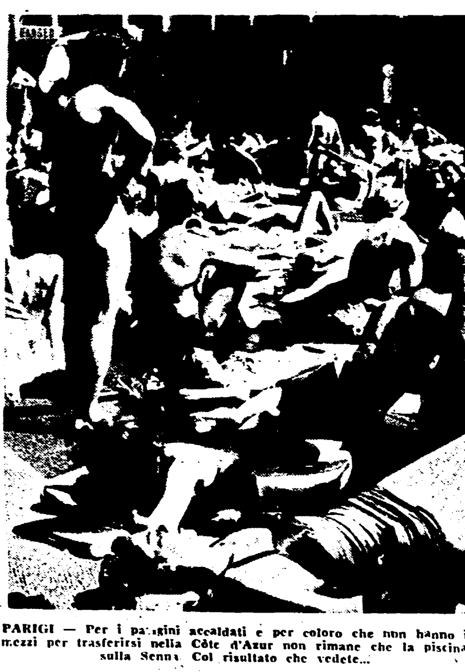
PARIGI — Per i parigini accaldati e per coloro che non hanno mezzi per trasferirsi nella Côte d'Azur non rimane che la piscina sulla Senna. Col risultato che vedete...