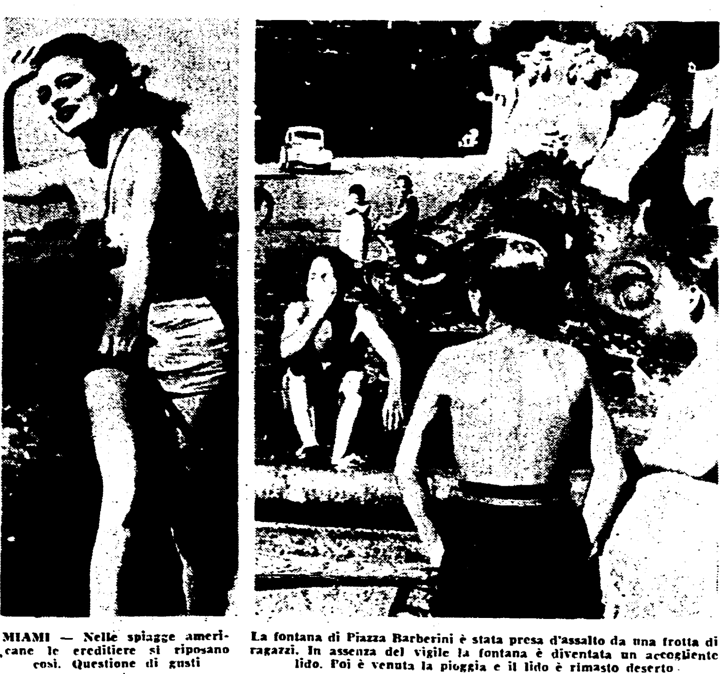
MIAMI — Nelle spiagge americane le ereditiere si riposano così. Questione di gusti