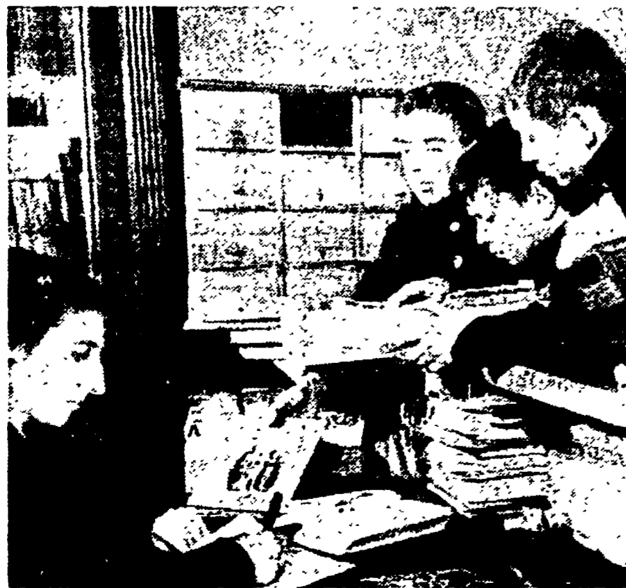
Entro il 1955, a conclusione del quinto piano quinquennale sovietico, si avrà in URSS il passaggio dal sistema scolastico settennale al sistema scolastico universale secondario di dieci anni...