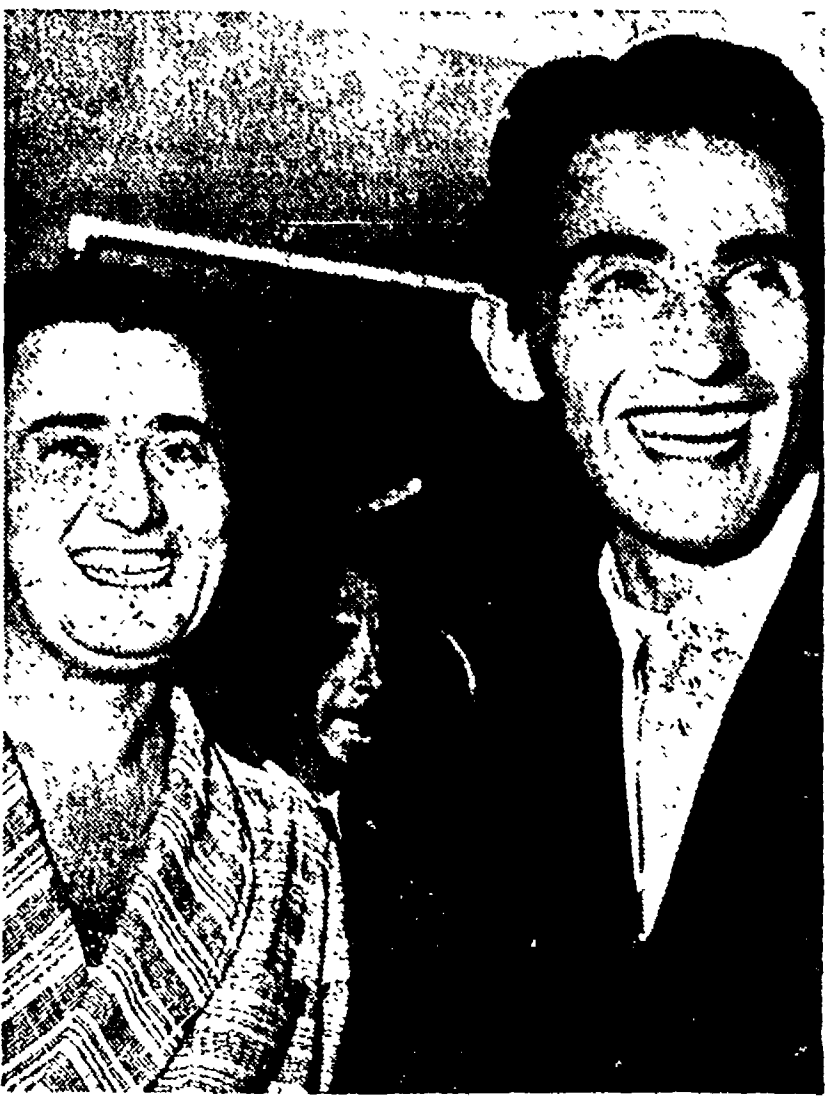
MILANO - Al Teatro Nuovo è stata preannunciata nei giorni scorsi con vivo successo «Gran barba nuda»...

Pierino oggi a casa farà la sua zuppa di collie... «Pierino oggi a casa farà la sua zuppa di collie, trentacinque anni fa si andava a Fanzana alla tombola...»