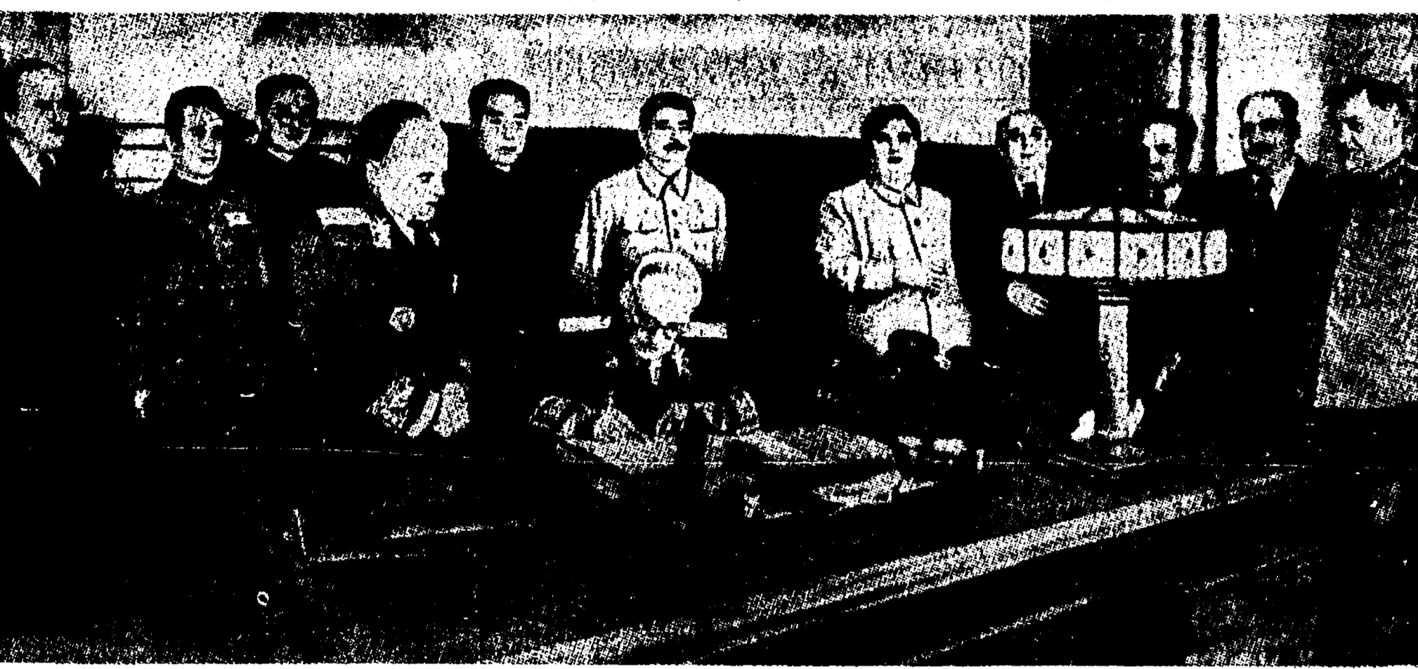
Il ministro degli Esteri sovietico Visinskij, firma l'accordo cino-sovietico su Port Arthur e la ferrovia di Ciang Ciung concluso al termine del colloquio che hanno avuto luogo nei giorni scorsi a Mosca. Accanto a Visinskij è il ministro del Commercio Estero sovietico Tinkin; dietro, da sinistra a destra: Molotov, Su-Yul, Ciang Ven-Ilen, Ciu En-Iai, Stalin, Malenkov, Beria, Mikolaj, Kaganovic e Bulganin