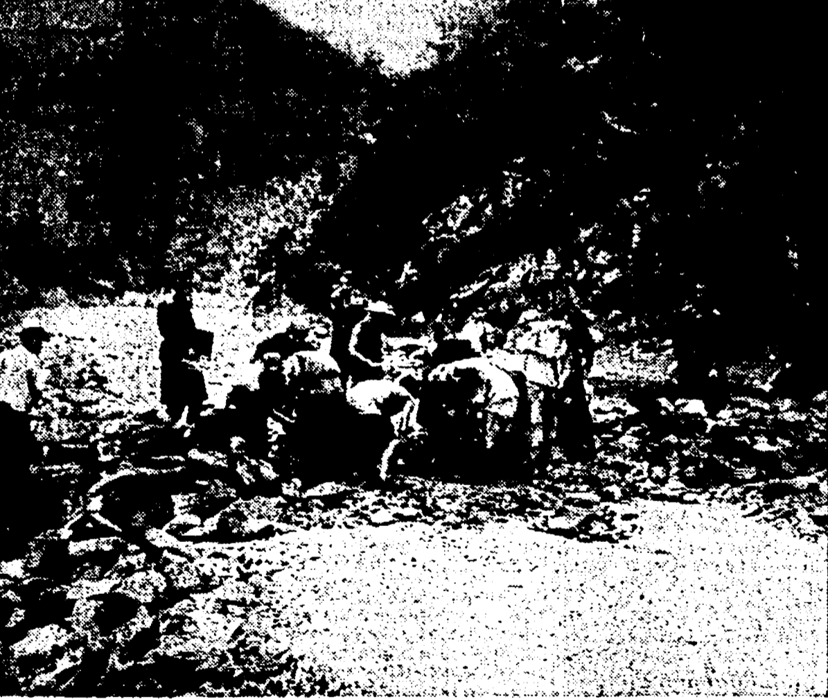
Bambini coreani costretti a lavorare malgrado la loro tenera età dagli invasori per riparare una strada danneggiata dalle recenti piene del fiume Inchin