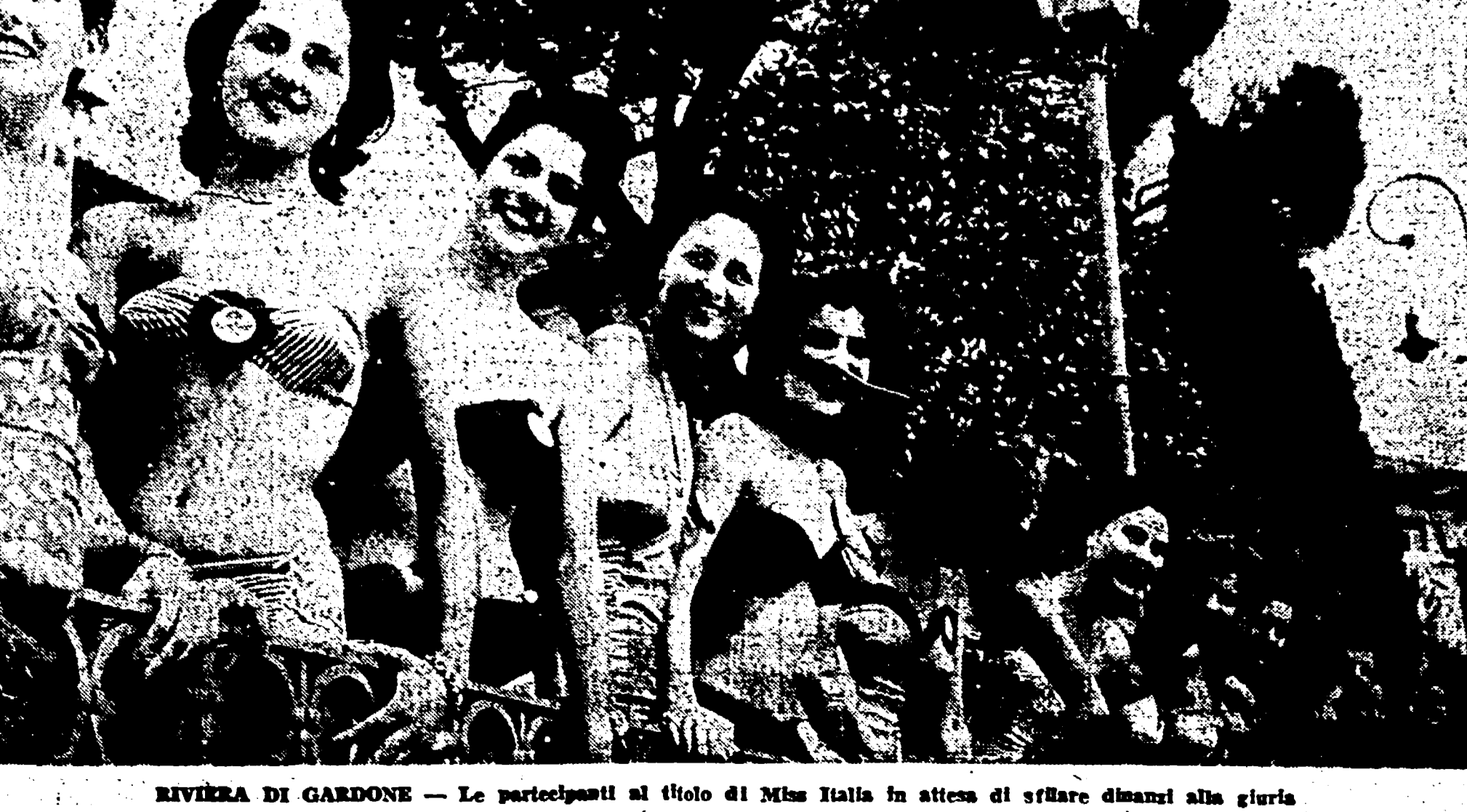
RIVIERA DI GARDONE — Le partecipanti al titolo di Miss Italia in attesa di sfidare dimanzi alla giuria

PIETRO INGRAMA - direttore Piero Clemente - vice direttore Stabilimento Tipografico U.S.I.L.A. Via IV Novembre, 149