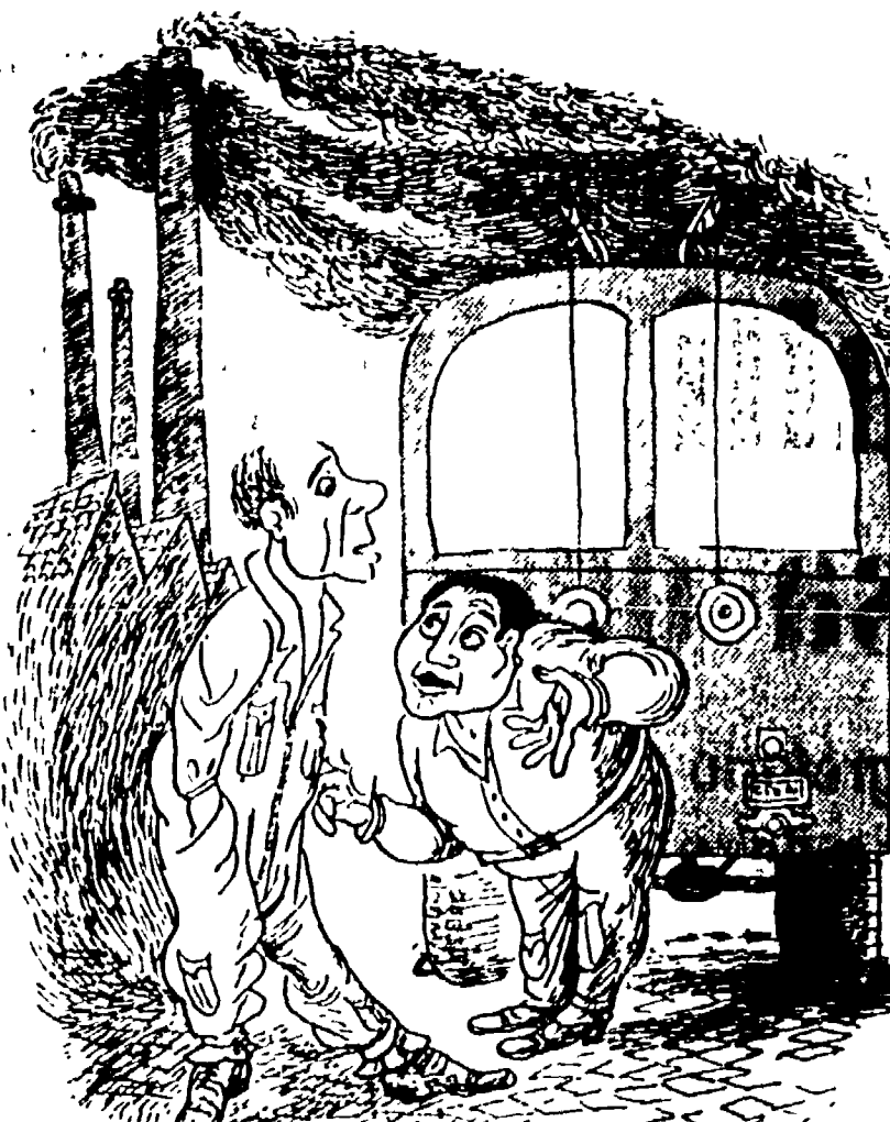
L'OPERAI DELLA C.I.S.A.: Per non farmi sentire il peso del aumento delle tariffe del tram mi vorrebbero licenziare...