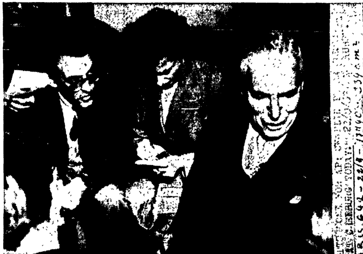
Charlie Chaplin, il primo a destra, mentre parla con i giornalisti al suo arrivo in Francia

CHERBOURG, 22. — «Io non sono un uomo politico. Credo nella libertà; questa è tutta la mia politica». Così, zitti, improvvisamente serio, con un accento di straordinaria fermezza nella voce e con lo sguardo fisso negli occhi del suo interlocutore, ha detto oggi Charlie Chaplin ai tanti giornalisti che si erano precipitati a salutarlo, applaudirlo e interrogarlo nel salone del Queen Elizabeth, fermo per qualche ora soltanto nel porto francese di Cherbourg.