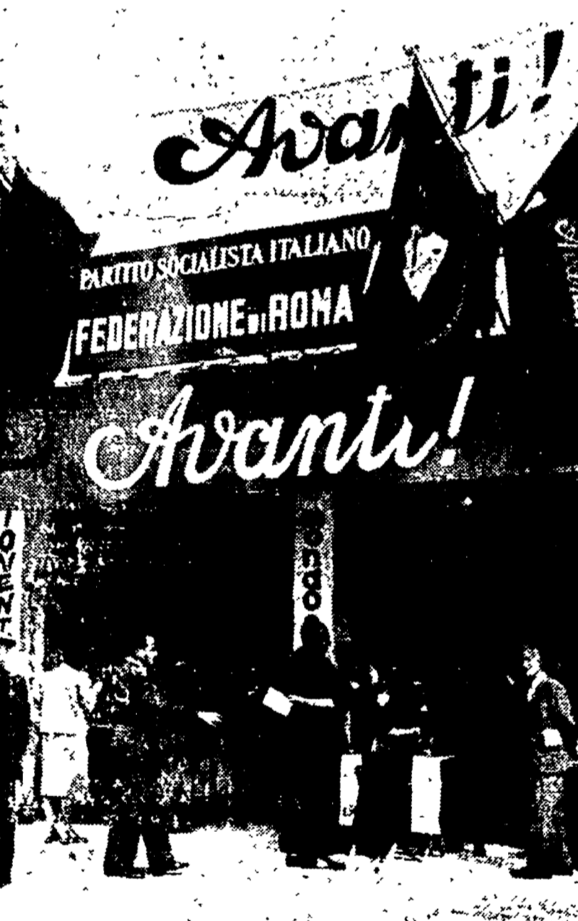
Allo stand della stampa socialista, che ogni giorno si batte validamente accanto a quella comunista per la verità e per la pace, è andata la simpatia delle migliaia di cittadini che hanno affollato fino a tarda sera il villaggio della festa