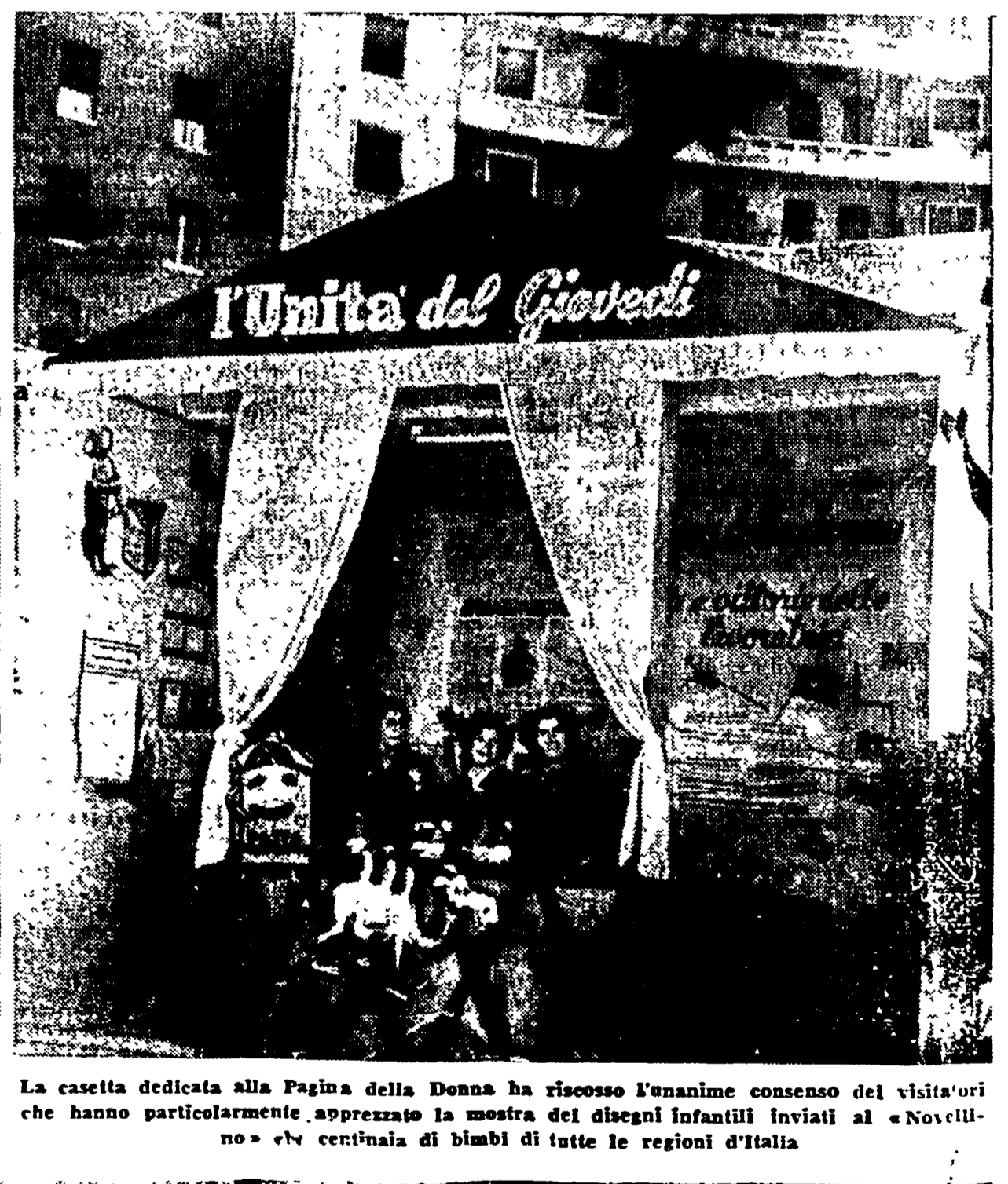
La casetta dedicata alla Pagina della Donna ha riscosso l'unanime consenso dei visitatori che hanno particolarmente apprezzato la mostra dei disegni infantili inviati al «Novellino» e che centinaia di bimbi di tutte le regioni d'Italia