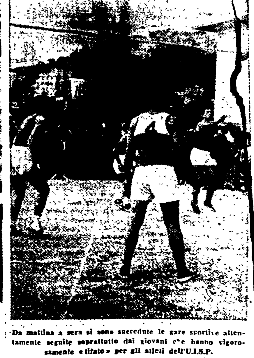
Da mattina a sera si sono succedute le gare sportive attentamente seguite soprattutto dai giovani e che hanno vigorosamente «tifato» per gli atleti dell'U.I.S.P.