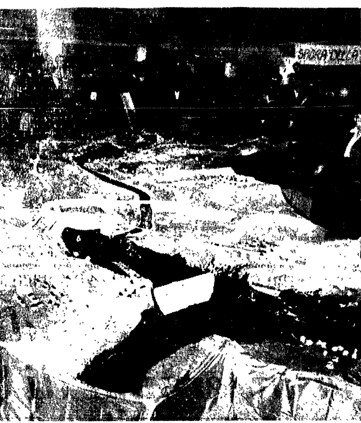
Alcune immagini della festa di ieri a Piazzale Cioleo. L'interessantissimo plastico del canale Volga-Don ha attirato l'attenzione di tutti. Uomini, donne e ragazzi hanno sostato a lungo di fronte alla minuziosa riproduzione discutendo animatamente del funzionamento delle chiuse, dell'ampiezza del mare di Tsimlianskaia, e degli altri particolari dell'opera