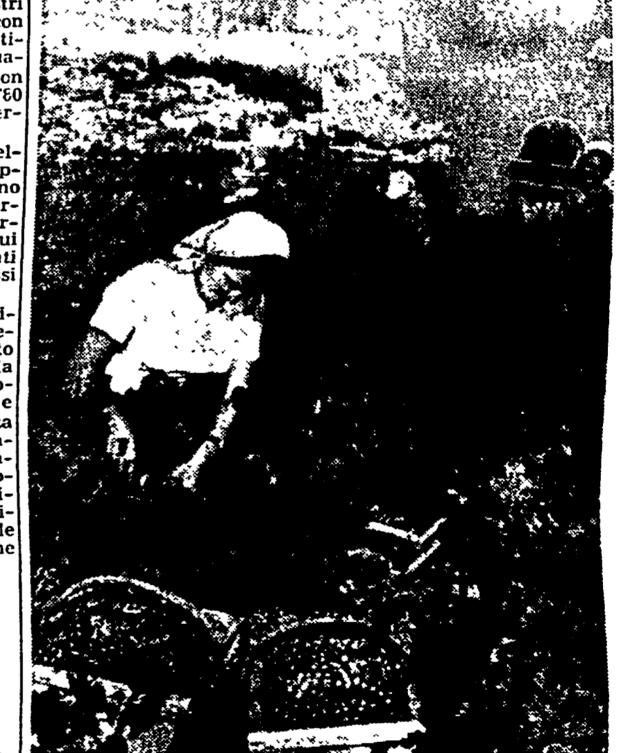
U.R.S.S. - Vendemmia in un sorcos sulle coste della Crimea.