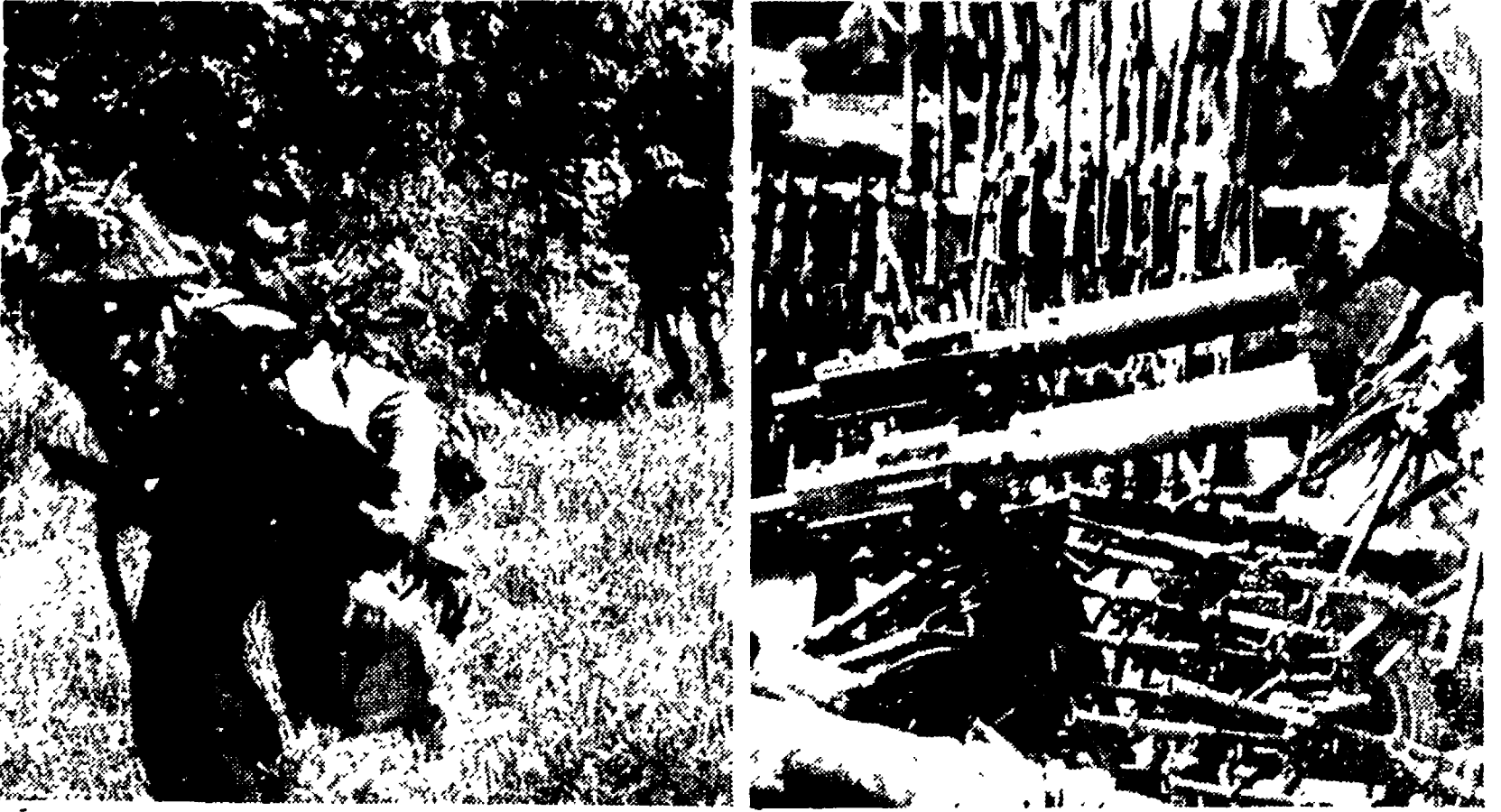
Reparti vietnamiti all'attacco nella zona di Van Yen liberata il 22 ottobre dalle truppe popolari. Un ricco bottino in armi e munizioni è caduto nelle mani dei vietnamiti in seguito alla liberazione di Nghia-lo

La battaglia del Fiume Nero nel Viet Nam