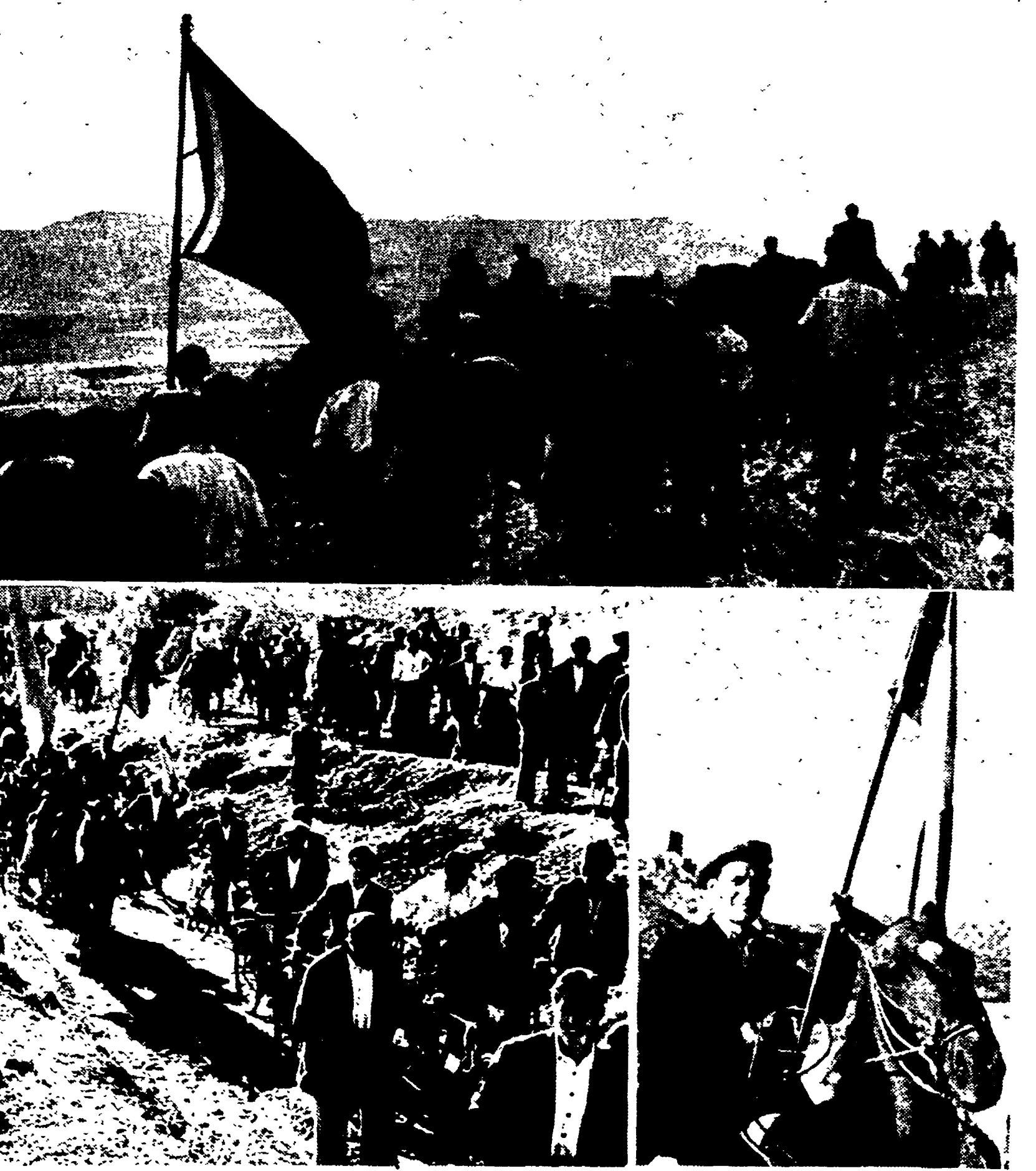
Con la parola d'ordine «distribuire tutte le terre prima delle semine», decine di migliaia di contadini poveri sono scesi di nuovo sulle terre in tutte le province della Sicilia, in Calabria e nella Maremma Laziale, per porre fine alle lungaggini e al sabotaggio delle autorità nella applicazione delle leggi stralcio e di riforma agraria