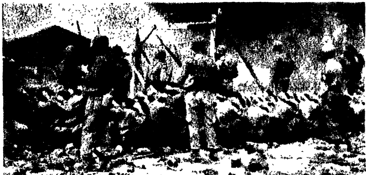
COREA - Ancora una volta la brutalità americana si è scagliata contro prigionieri inermi