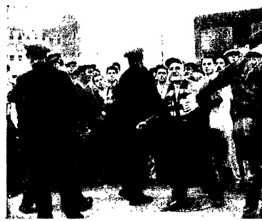
Un pacifico corteo attaccato dalla polizia

SYDNEY, 4. - Cinque lavoratori italiani emigrati in Australia in seguito agli accordi intercorsi tra i governi dei due paesi e abbandonati in una drammatica situazione, senza lavoro e senza denaro, dalle autorità australiane, sono compariti oggi dinanzi al tribunale di Sydney. Essi sono accusati di «condotta offensiva» e «partecipazione a un corteo non autorizzato» per aver manifestato il 30 ottobre in difesa del loro diritto.