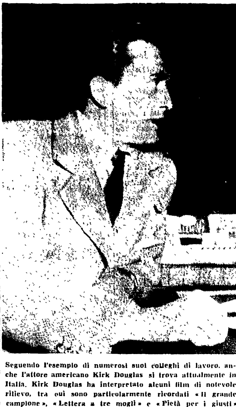
Segue l'esempio di numerosi suoi colleghi di lavoro, anche l'attore americano Kirk Douglas si trova attualmente in Italia...