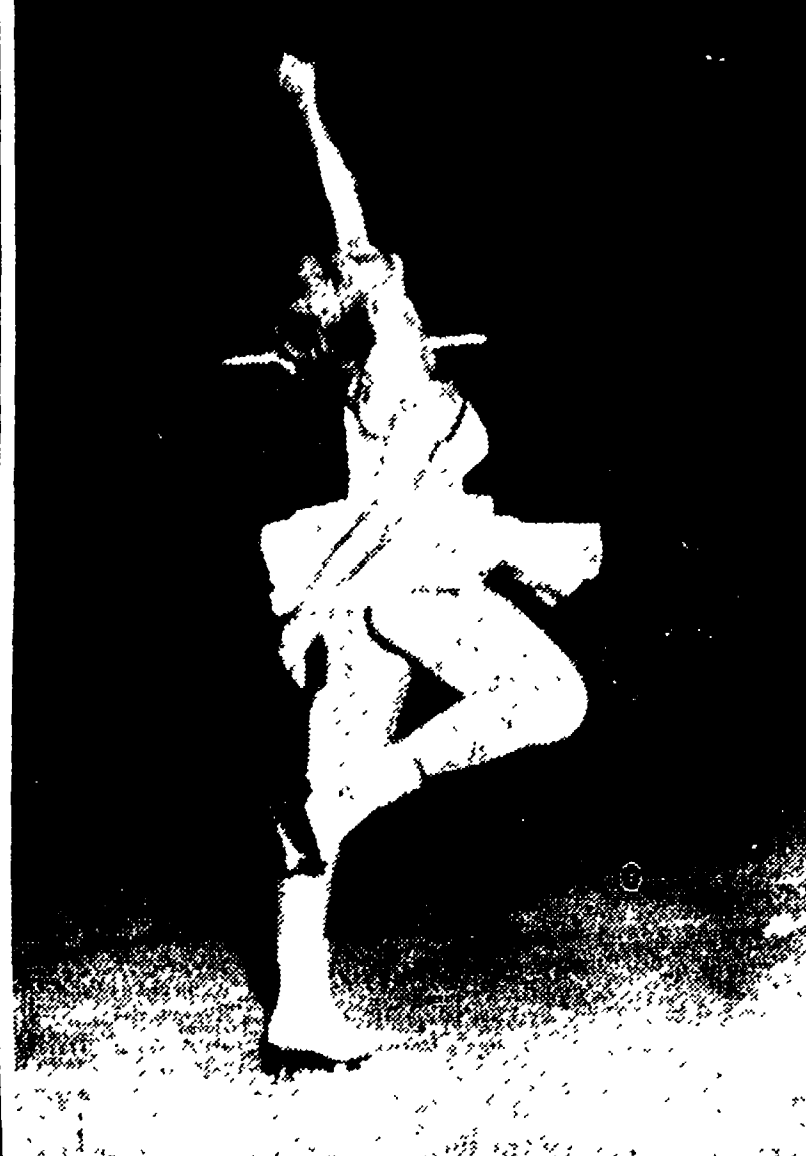
GUNDI BUSCH, campionessa olimpionica di pattinaggio su ghiaccio. La Busch si esibita a Milano nei giorni scorsi nell'intervallo della partita di hockey su ghiaccio tra il «Grassoppher» di Zurigo e l'I.C. Milano.

Ma io non so necessario qui. Voi lo non lo siete. Poiché di sei tu, bisogna che sia anch'io.