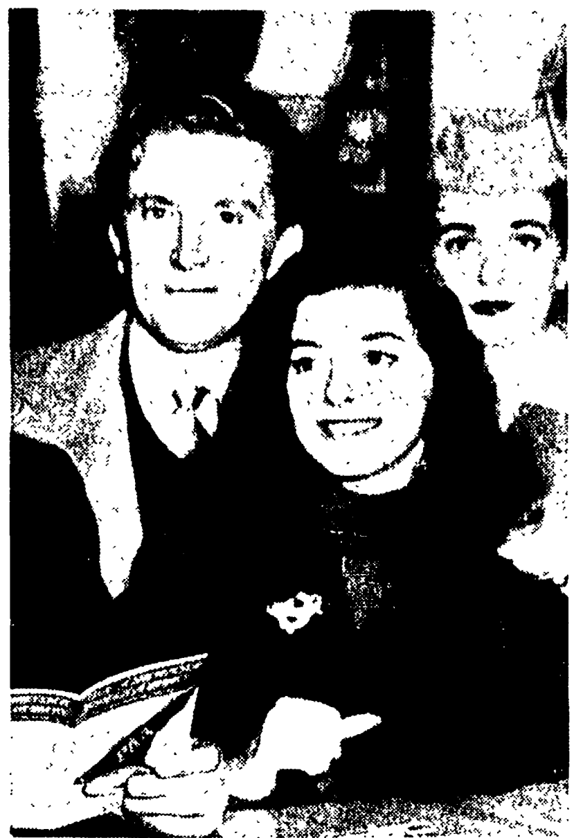
Anna Maria Pierangeli e Kirk Douglas fotografati alla vigilia della loro partenza, l'una per l'America, l'altro per Parigi. Nonostante la momentanea separazione, corrono insieme le voci di un possibile futuro matrimonio tra i due attori

La sorte del soldato Somaal - Dall'interventismo nella prima guerra mondiale alla posizione di oggi - Una voce sempre più forte di cui si dovrà tener conto