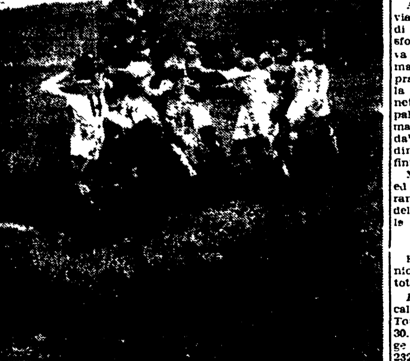
RUGBY ROMA-BRESCIA 5-3: Su ripresa laterale falla Riccioli ostacolata dal biancazzurri bresciani

Il gioco chiuso dei bresciani favorito dal terreno pesante