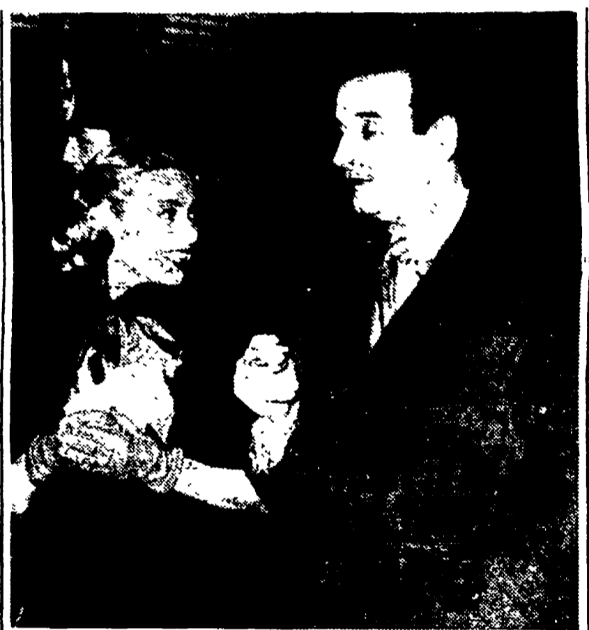
Christian-Jaque e Martine Carol per le vie di Roma