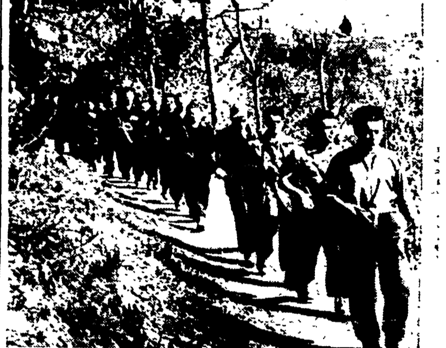
L'Istituto inaugurato a Milano raccoglierà la documentazione sui cento e cento episodi di eroismo che portarono, attraverso giorni durissimi sulle montagne e sulle pianure d'Italia all'insurrezione e alla liberazione della Patria.

Christian-Jaque lavora molto volentieri in Italia dove ha già realizzato un'edizione della Carmen con Viviane Romance e La Certosa di Parma. In particolare, il fascino del regista è per il popolo di Viterbo, e soprattutto in Germania, circondando, dal quindicesimo secolo in poi, la figura di questo eroe del popolo, burlesco, movido, e soprattutto belligeramente crudele di principi, preti e borghesi.