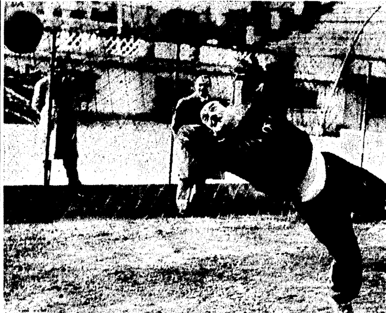
Ieri mattina, prima di lasciare Roma, gli azzurri convocati per la Nazionale «A» hanno svolto allo Stadio «Torino»...