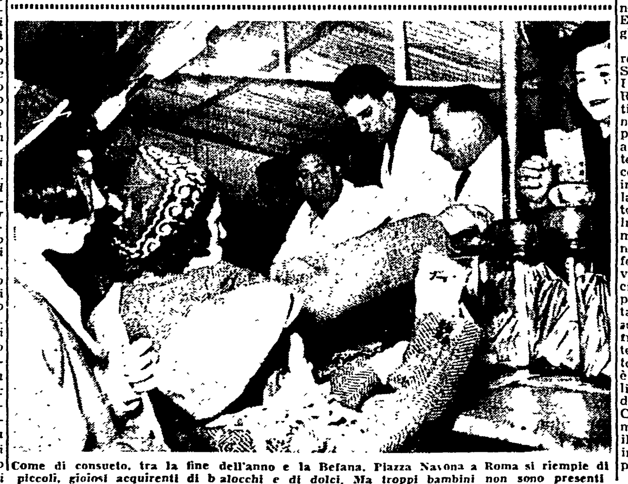
Come di consueto, tra la fine dell'anno e la Befana, Piazza Navona a Roma si riempie di piccoli, gioiosi acquirenti di baci e di dolci...