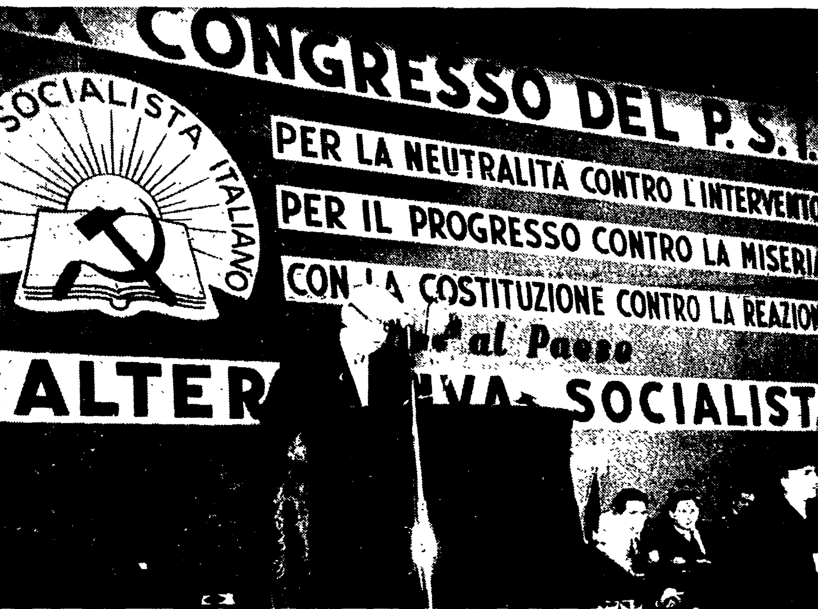
MILANO. — Nenni conclude i lavori del Congresso del P. S. L. che si è tenuto nei giorni scorsi al Teatro Lirico.