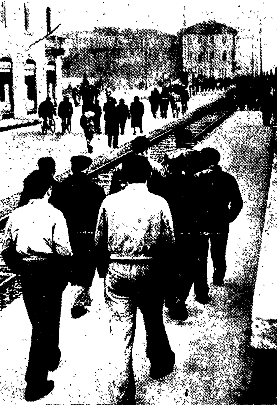
SESTO S. GIOVANNI. — Un aspetto dello sciopero di protesta contro la legge truffa d. c. In tutta Italia cresce ogni giorno il movimento popolare in difesa della Costituzione e dell'uguaglianza del voto