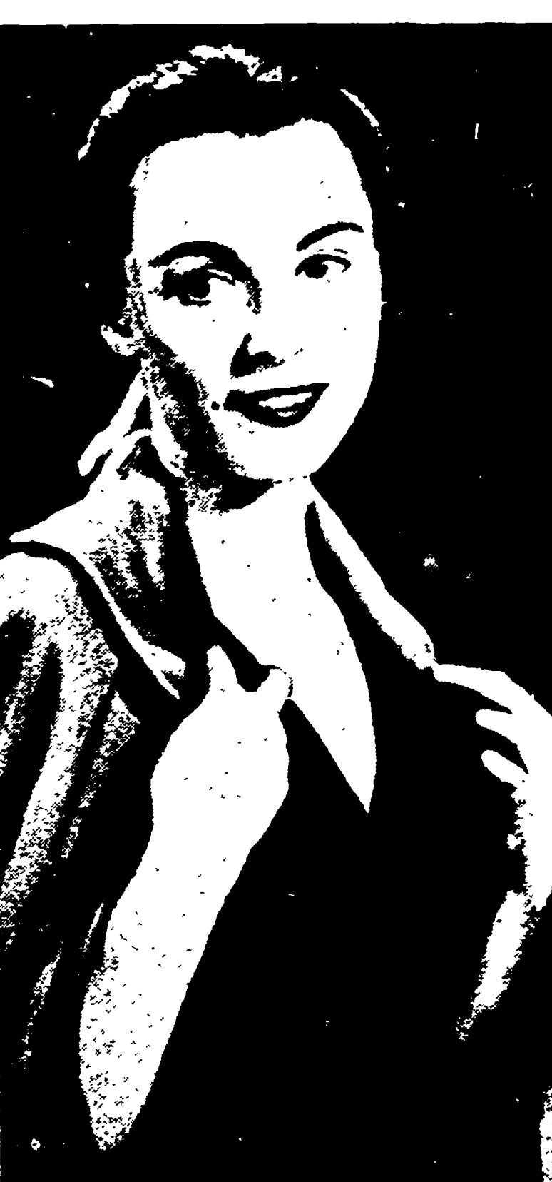
Una dolce immagine di Claire Bloom, la bellissima e bravissima interprete dell'ultimo film di Chaplin «Limelight»