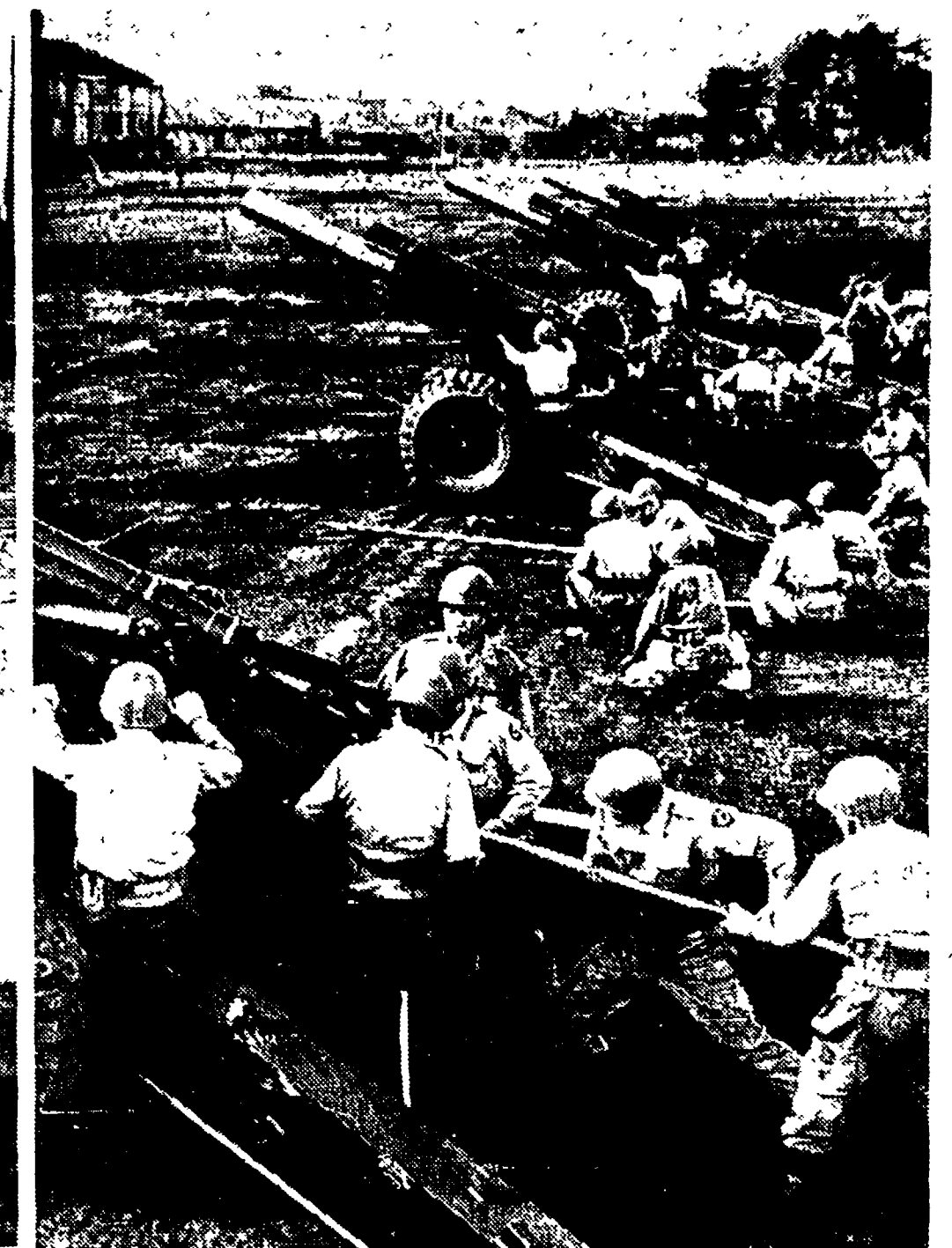
TOKIO. — Una batteria della nuova armata giapponese di stanza a Yokohama City in azione. I cannoni «Howitzer» da 105 e 150 mm. sono forniti dagli Stati Uniti