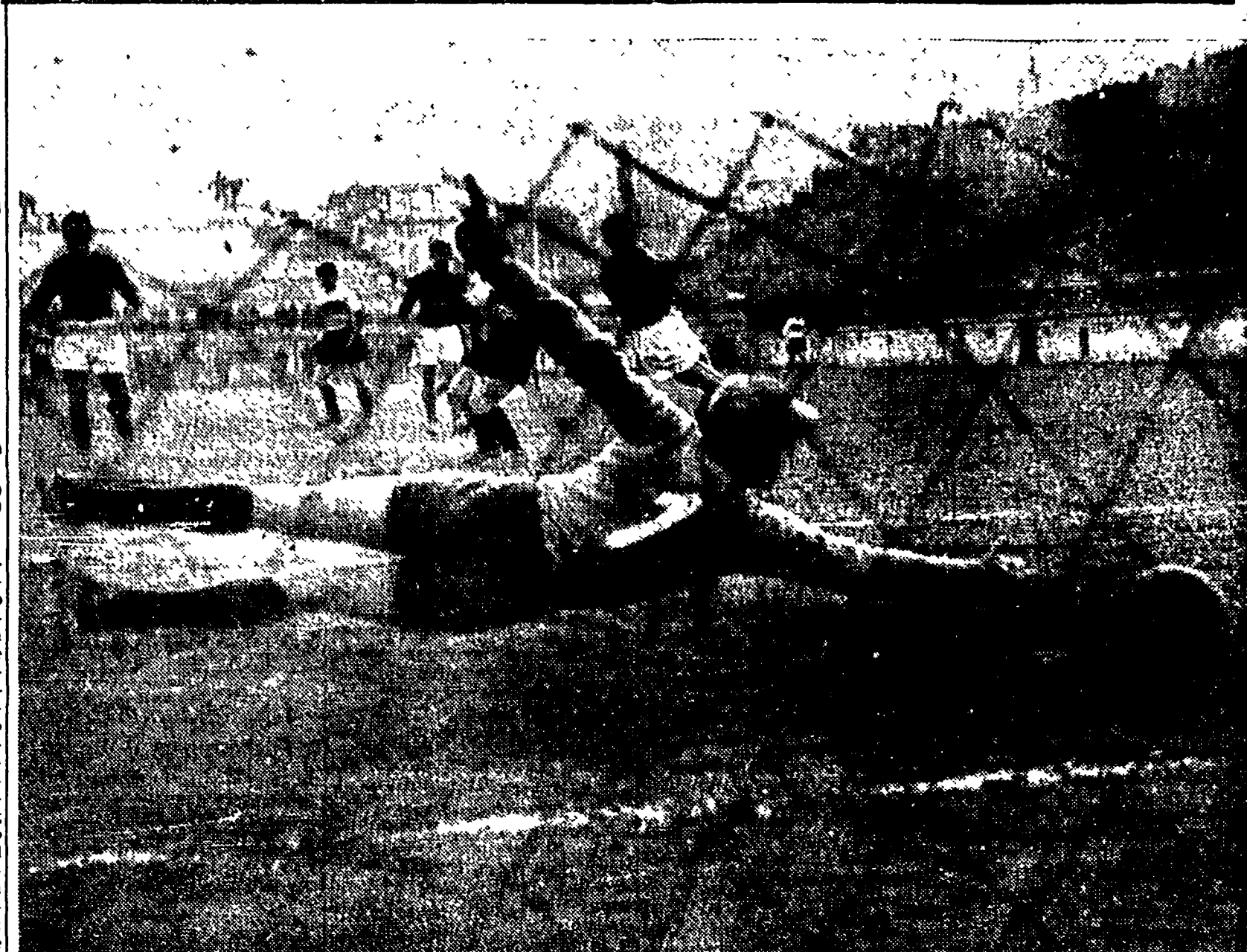
ROMA-TRIESTINA 2-2: la Roma, in svantaggio per 2-0 dopo i primi 45', ha faticato parecchio a raggiungere gli alabardati. Ecco Nucari battuto dal primo goal romanista, autore Pandolfini