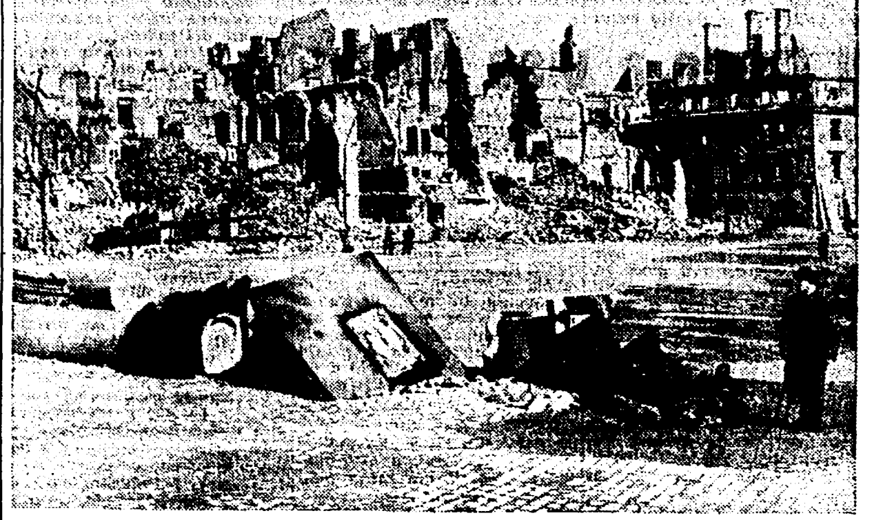
La tragica visione del Ghetto di Varsavia, dopo la sistematica distruzione operata dai nazisti

aveva scritto, alla voce «profezione» del formulario per l'apertura del conto, la qualifica di «proprietario».