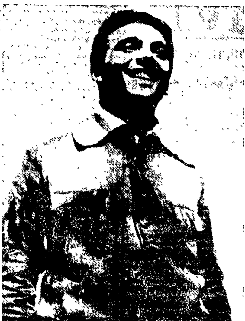
Ritorno in questi giorni il cinquantenario del Partito comunista ed eroe del popolo cecoslovacco...