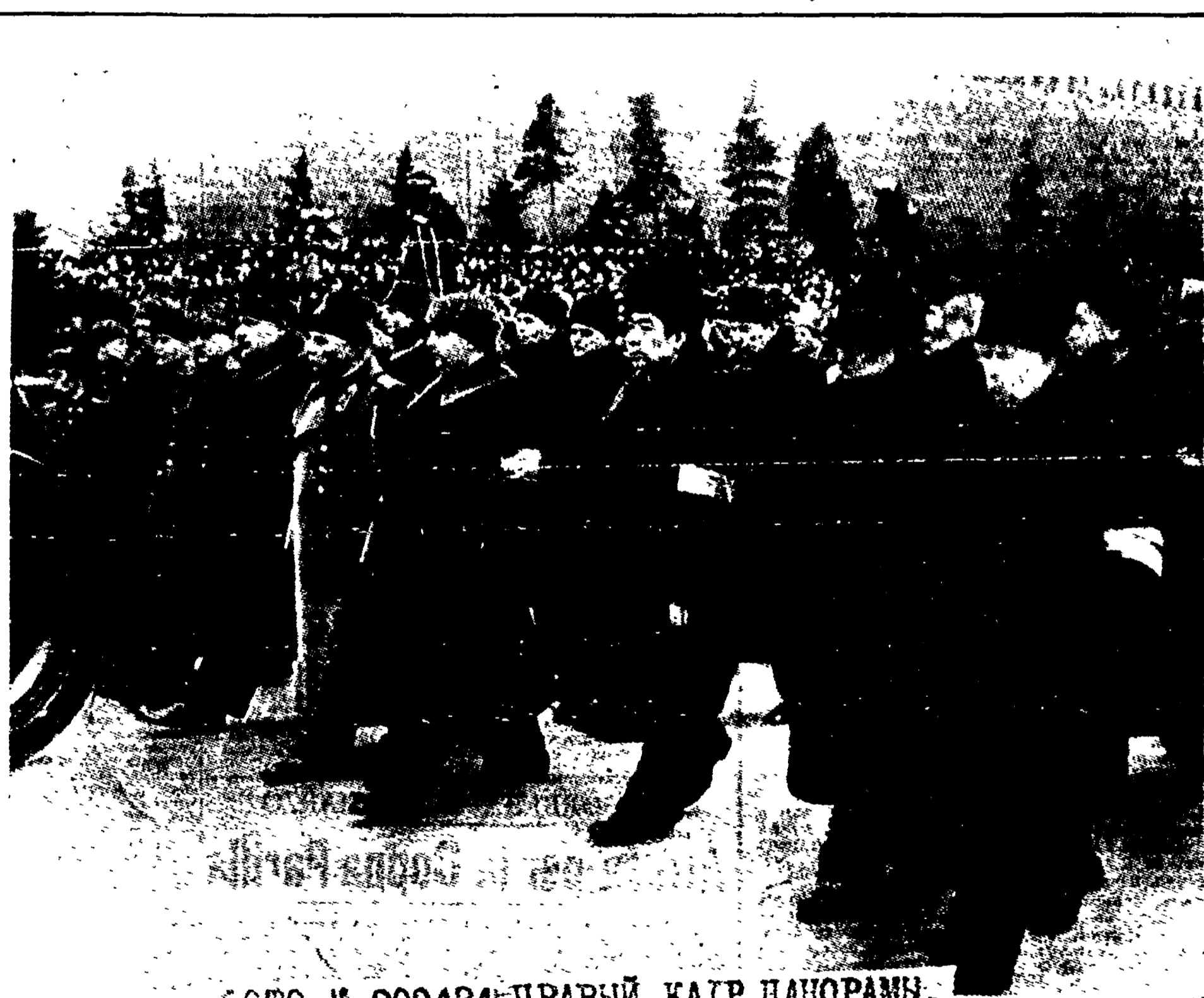
Seguono il feretro: Molotov, Bulganin, Kaganovic, Vorosilov, Malenkov, Cia En-lai, Beria, Krusciov