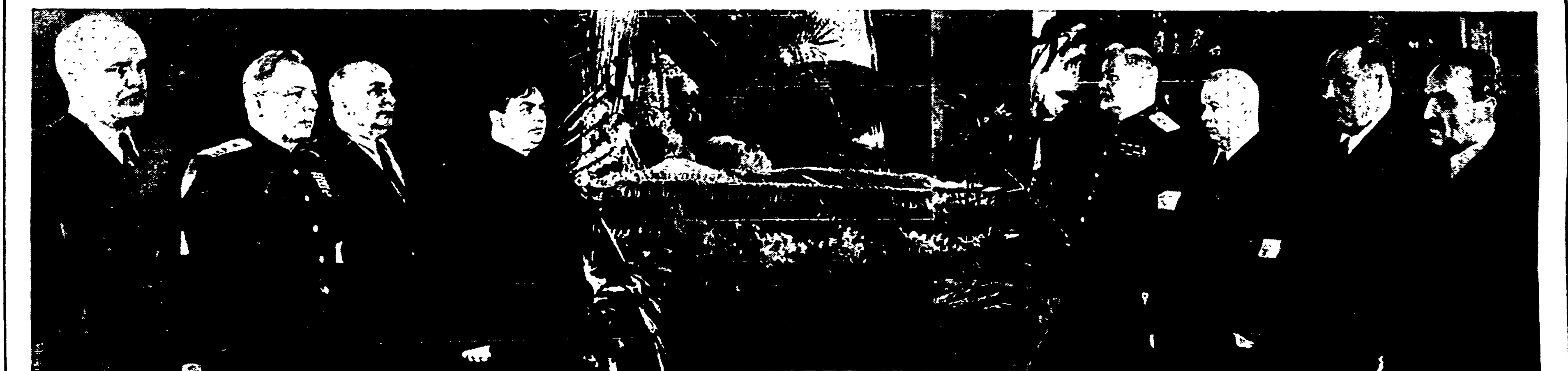
I dirigenti del Partito comunista e del Governo sovietici montano la guardia d'onore attorno alla salma di Stalin. Da sinistra a destra: Molotov, Vorosilov, Beria, Malenkov, Bulganin, Krusciov, Kaganovic, Mikoin