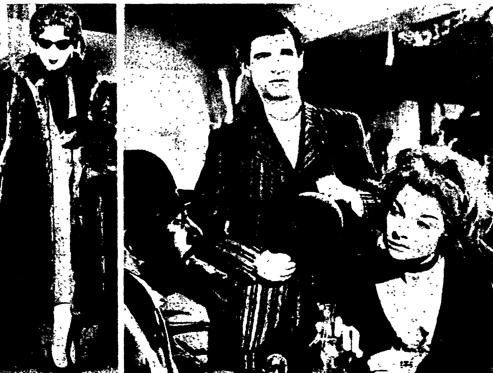
GINEVRA — L'ex regina d'Egitto, Narriman Sadek, ha abbandonato Faruk e si è recata in Svizzera per facilitare le pratiche di divorzio. La Sadek, discendente di una nobile famiglia, ha dichiarato di non poter più vivere con Faruk e per ragioni private e precise che il grosso marito la sottoponeva a umiliazioni e conduceva una vita di pubblico scandalo, contraria alla morale.