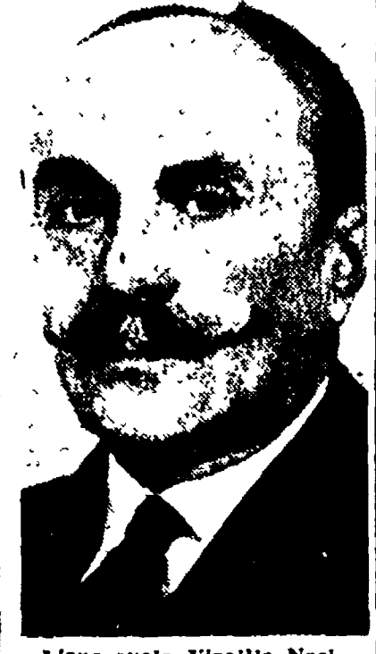
L'onorevole Virgilio Nasi

La riunione del comitato preparatorio inizia quest'oggi a Vienna.