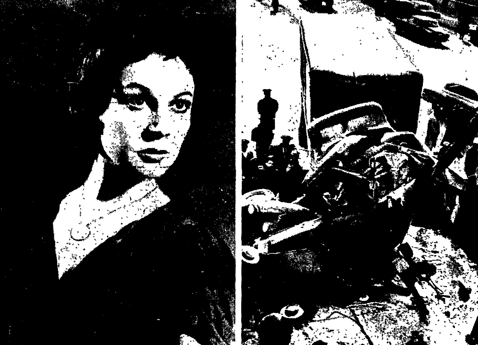
HOLLYWOOD — La bella e sensibile attrice inglese Vivien Leigh è seriamente ammalata: è stata colpita da un collasso nervoso dopo un viaggio di 72 ore in aereo da Ceylon ad Hollywood dove aveva interpretato un film d'ambiente indiano. Allarmatissimo, suo marito Laurence Olivier l'ha subito raggiunta in volo abbandonando le vacanze che aveva iniziato a Forte d'Ischia.