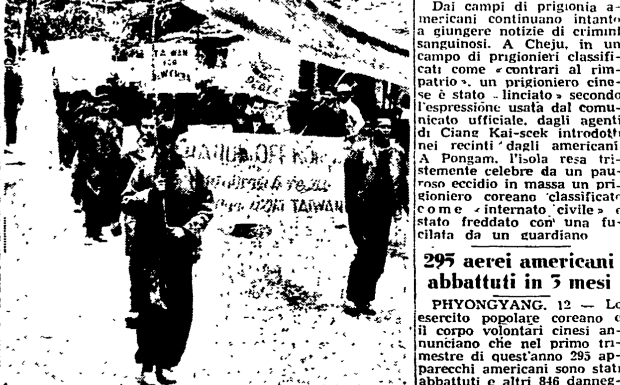
CORSA - Un vasto movimento in favore della pace in Corea e sorto tra i prigionieri-americani