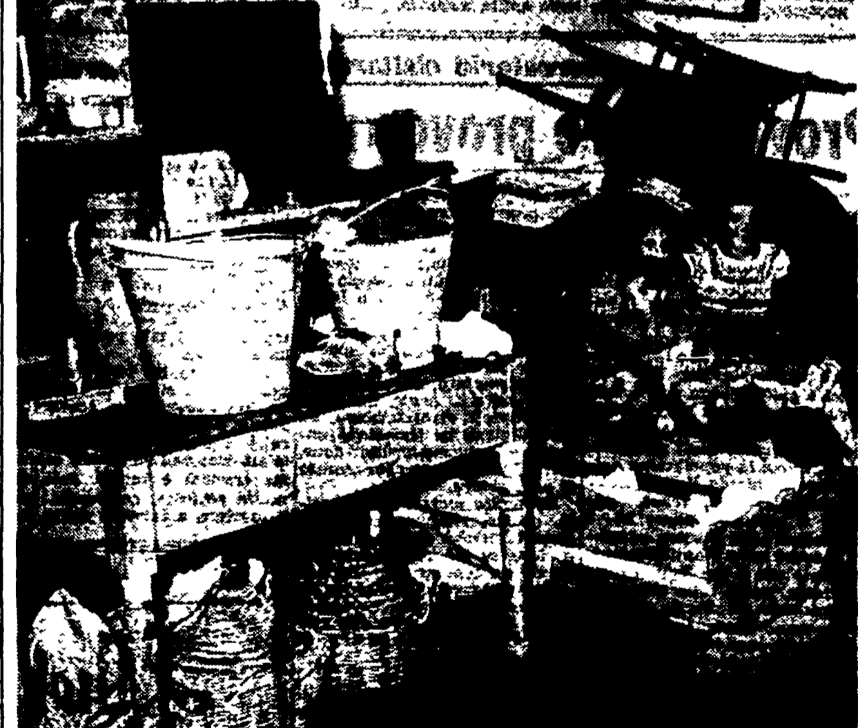
BARI - Ecco come si vive nelle «casermette» di Torre Tresca. E la stessa scena si ripete ovunque, nei «Sassi» di Matera, nei «bassi» di Napoli. Sono le realizzazioni del governo d.c.

GUIDO NOZZOLI A VALLE GIULIA Oggi la conferenza di Tzara su Picasso