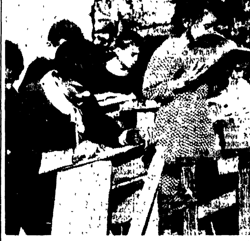
Scene come queste si ripetono ancora oggi in tanti paesi d'Italia. La carenza di aule è ancora un male pericoloso della nostra scuola.