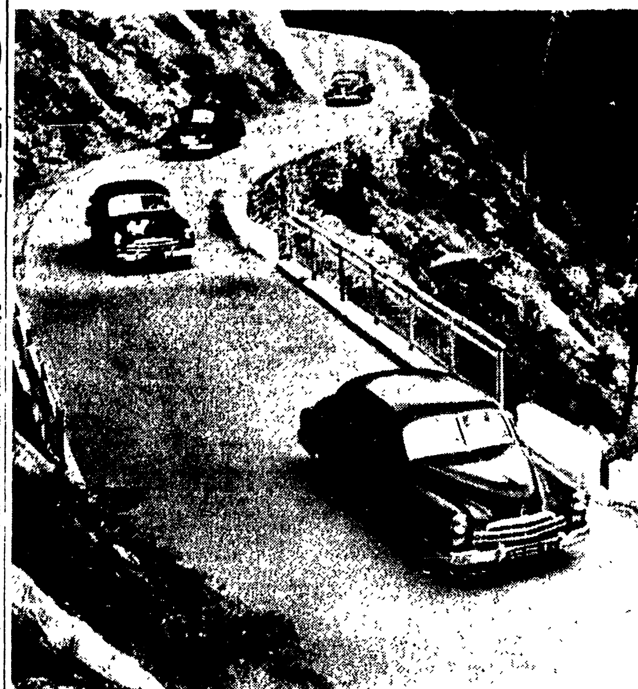
L'ultimo tipo di ZIM, la lussuosa macchina sovietica, viene collaudato sulle ripide e pittoresche strade del Caucaso