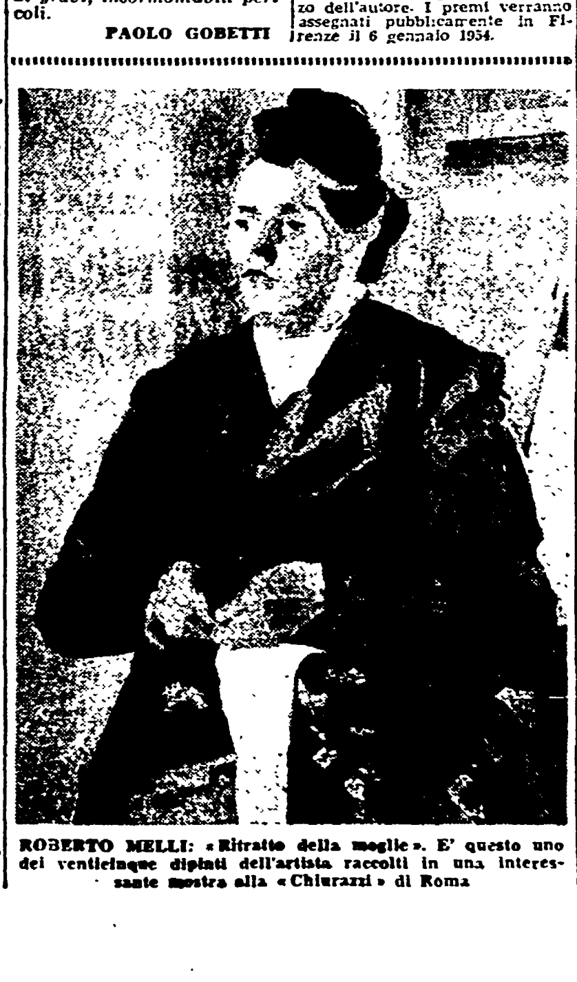
ROBERTO MELLI: «Ritratto della moglie». E' questo uno dei ventisei dipinti dell'artista, in una interessante mostra alla «Chitrazzari» di Roma.

La trama di questa commedia, che è brillante e non nelle imitazioni dei suoi autori, è molto semplice: un ragazzo, che si trova in un'aula di scuola, si veda a trovarsi in mille comiche avventure. La faccenda serve da pretesto a Dean Martin per cantare.