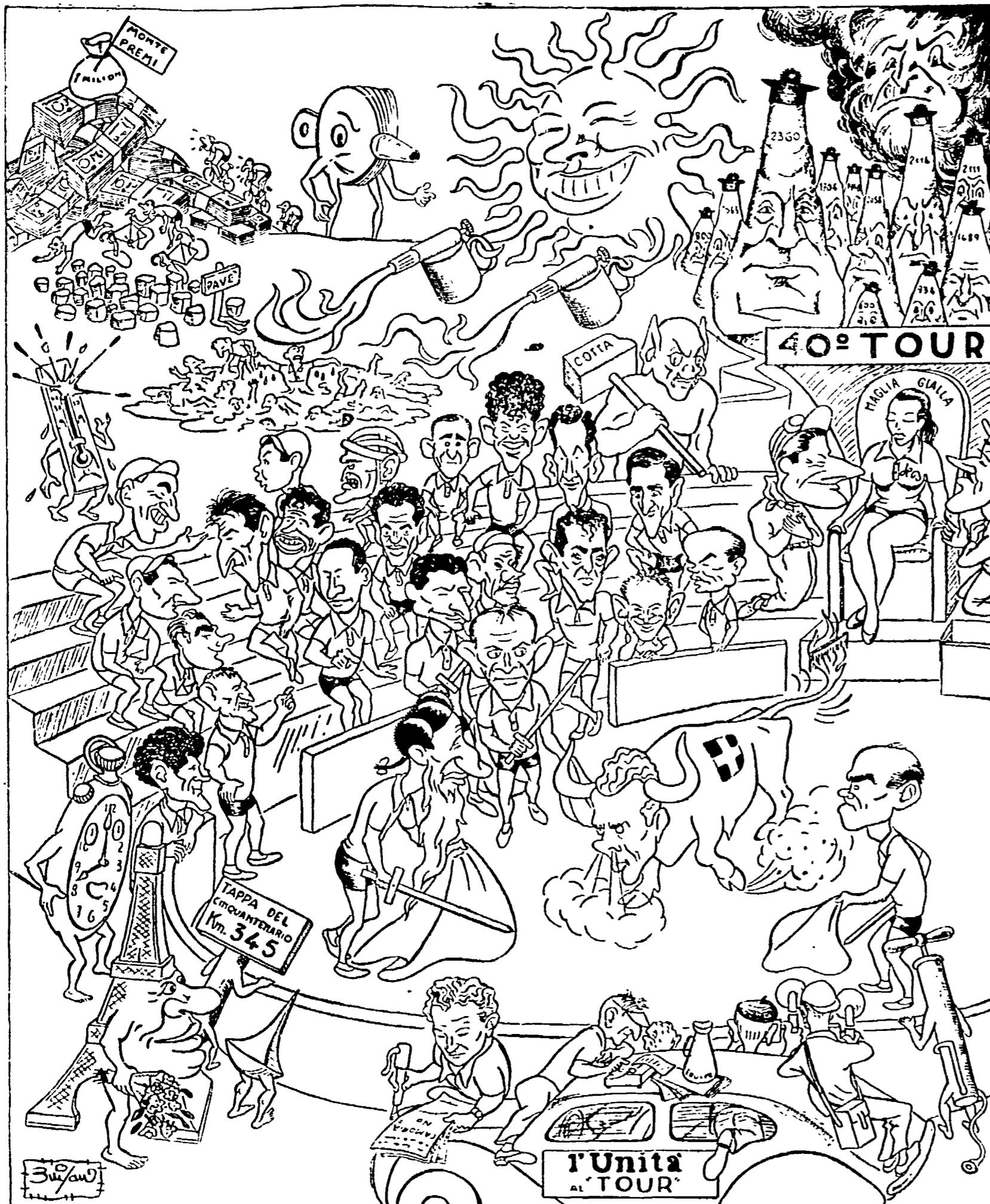
Nell'arena del «Tour» i toro e toreri iniziano oggi il grande duello

Centoventi corridori tentano la grande avventura sulle strade francesi