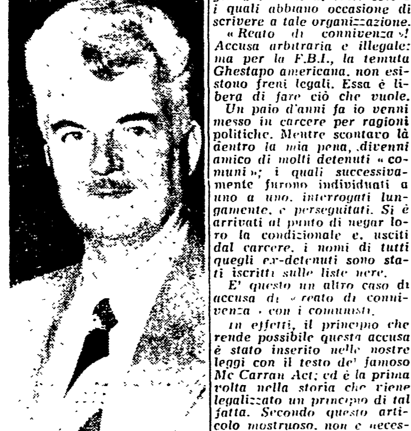
Engene Dennis, segretario del P.C. americano