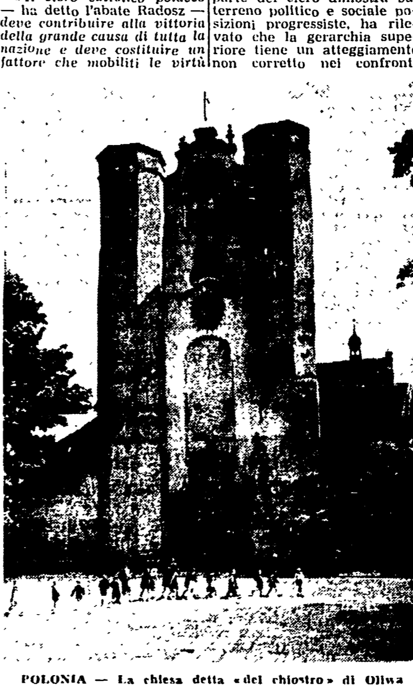
Polonia - La chiesa detta «del chiostro» di Oliva

Le conclusioni cui si è pervenute nelle riunioni regionali, che come si è detto, sono arrivate in corso. A Wroclaw, dove si sono riuniti 358 sacerdoti, 53 tra frati e suore e un gran numero di cattolici laici, è stato ripreso il problema della partecipazione del cattolico alla vita politica e sociale della nuova Polonia. Particolarmente interessante è stato l'intervento dell'abate Szpil il quale, dopo avere sottolineato che la maggior parte del clero dimostra sul terreno politico e sociale posizioni progressiste, ha rilevato che la gerarchia superiore tiene un atteggiamento non corretto nei confronti