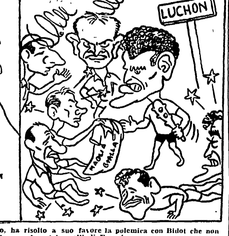
ROBIC, sgominando l'intero campo, ha risolto a suo favore la polemica con Bilot che non l'ha voluto nella squadra dei "galli di Francia"

1) ROBIC p. 28; 2) Loroño, 31; 3) Schaer, 31; 4) Bauvin, 19; 5) Astrua, 15; 6) Huber e Bobet, 14; 8) Le Guillu, 9; 9) Van Genechten 11