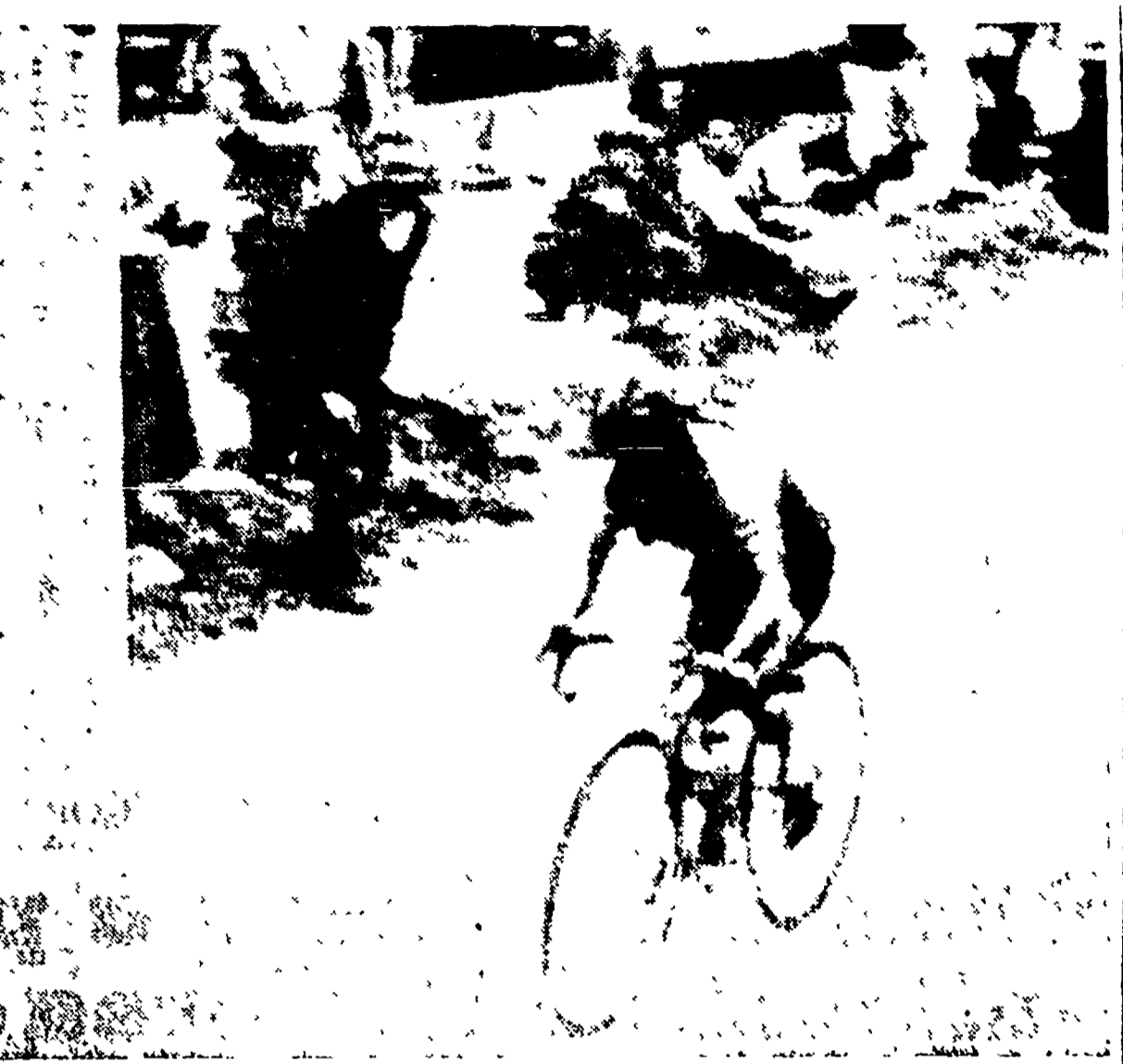
ROBIC fra la folla plaudente vola verso il traguardo di Luchon - (Fototele all'Unita)

Robic è scappato subito appena il Col du Tourmalet si è mosso: è scappato con Le Guillu, Loroño e Schaer. Sul Col du Tourmalet, soltanto Le Guillu ha resistito agli scatti di Robic. Poi Le Guillu non ha avuto fortuna: è caduto nella discesa. Robic allora, è scatenato. Ha continuato a ballare sui pedali; nessuno lo ha visto più: Robic si è erampicato da solo sul Col d'Aspin e sul Col de Peyresourde, e, solo ha strapato il nostro del traguardo di Bagneres-de-Luchon. Malgrado la bella rincorsa di Bobet, malgrado la cac-