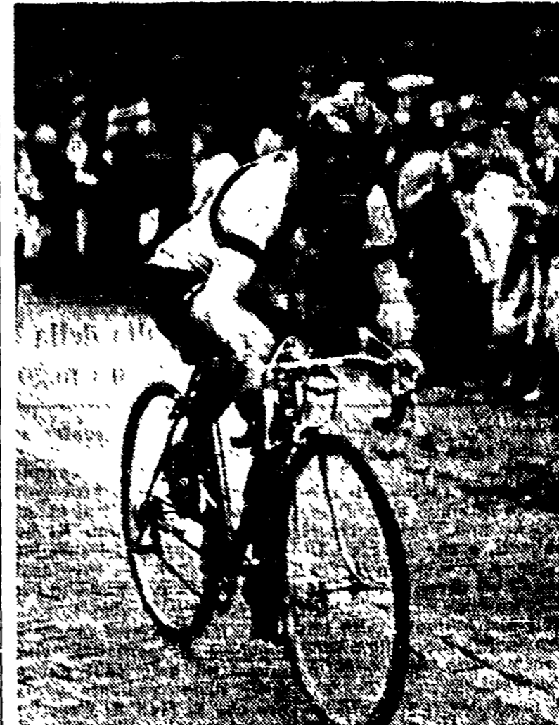
JEAN ROBIC, vittima nella tappa Albi-Beziers di una caduta non di presentimento per la partenza. Le sue condizioni di salute, pur non destando preoccupazioni, non sono buone: il piccolo orologgero bretonese ha fortissimo dolori alla testa. Auguri Robic!