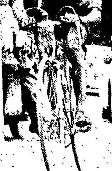
GINO BARTALI ha finito ieri sulle strade del «Tour» 39 anni. Come il prossimo? (metri 218), ecco il Col de Gratteloup (metri 200), il Col de l'Estère (metri 214) e il Col de l'Èze (metri 508), che è proprio lì, a picco, sul traguardo e sembra una scala che arriva al cielo.

L'argentino Fangio ad un solo minuto dal vincitore - Nino Farina vittorioso nella formula libera