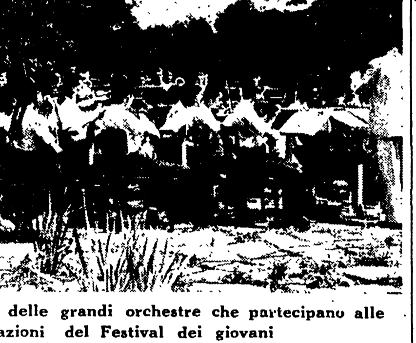
BUCAREST — Una delle grandi orchestre che partecipano alle manifestazioni del Festival dei giovani

Si è annunciato stasera che i gruppi neutrali raggiungeranno domani i centri di raccolta e di smistamento delle due parti, per controllare la regolarità delle operazioni. Per la prima volta si uniranno al rappresentativo neutrali, il gruppo della Corea Rossa. RICCARDO LONGONE.