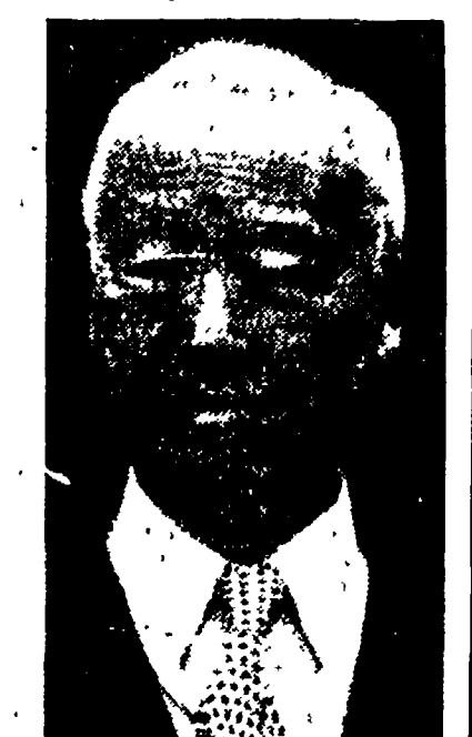
Il boia Si Man Ri

l'accordo per l'evacuazione di tutte le truppe straniere dalla Corea, che deve essere raggiunto nella conferenza politica. Si impegna a riprendere le ostilità a fianco di Si Man Ri, ripetendo l'operazione del giugno-luglio 1950 dopo aver utilizzato il fantoccio sud-coreano per provocazioni contro la Repubblica coreana e contro l'armistizio.