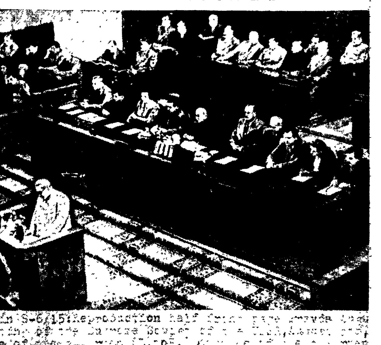
La riunione del Soviet supremo mentre alla tribuna parla il Ministro Zverev (Telefoto)